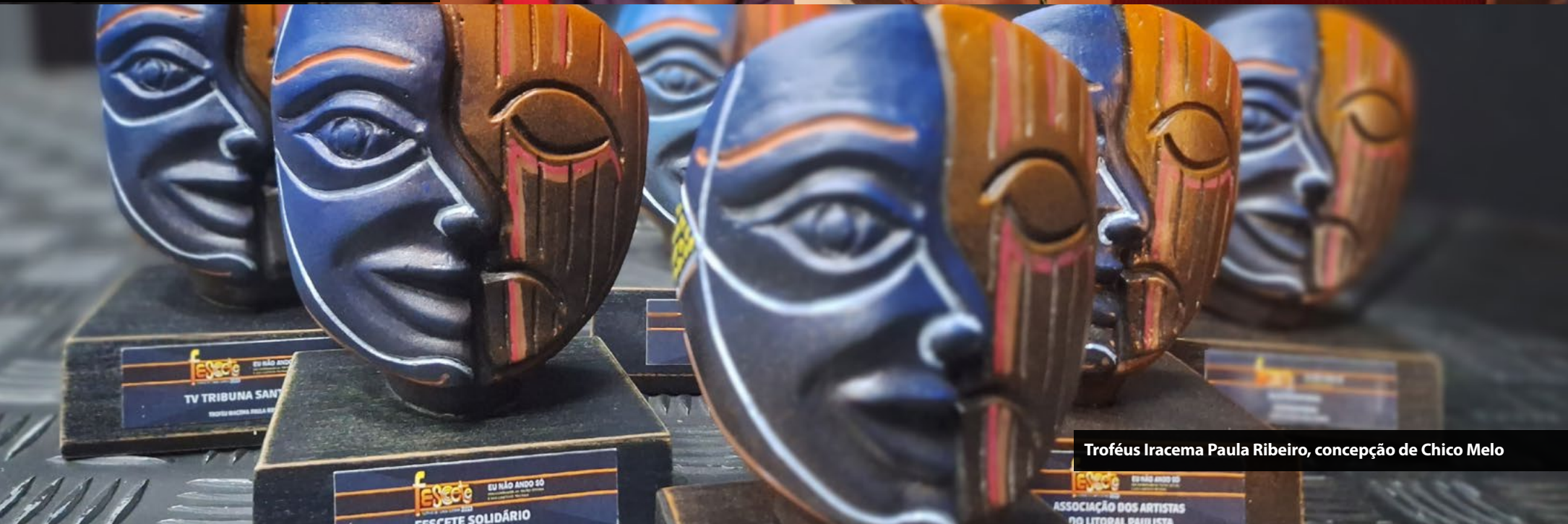
Troféus Iracema Paula Ribeiro, concepção de Chico Melo