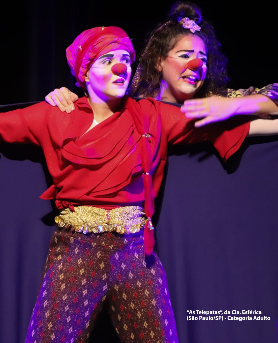
"As Telepatas", da Cia. Esférica (São Paulo/SP) - Categoria Adulto