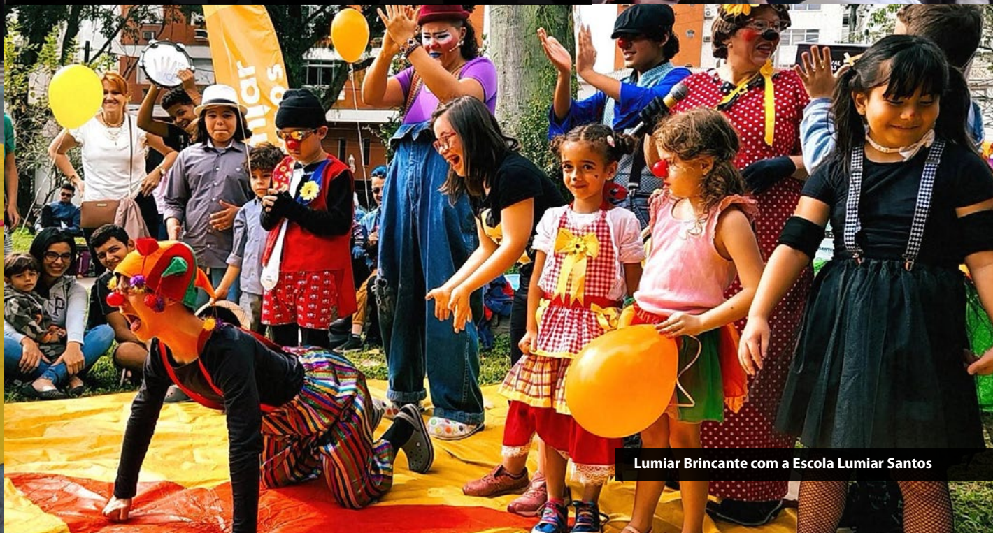
Lumiar Brincante com a Escola Lumiar Santos