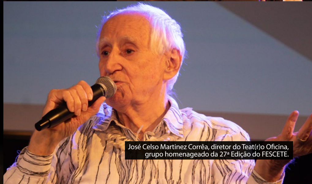
José Celso Martinez Corrêa, diretor do Teat(r)o Oficina, grupo homenageado da 27ª Edição do FESCETE.