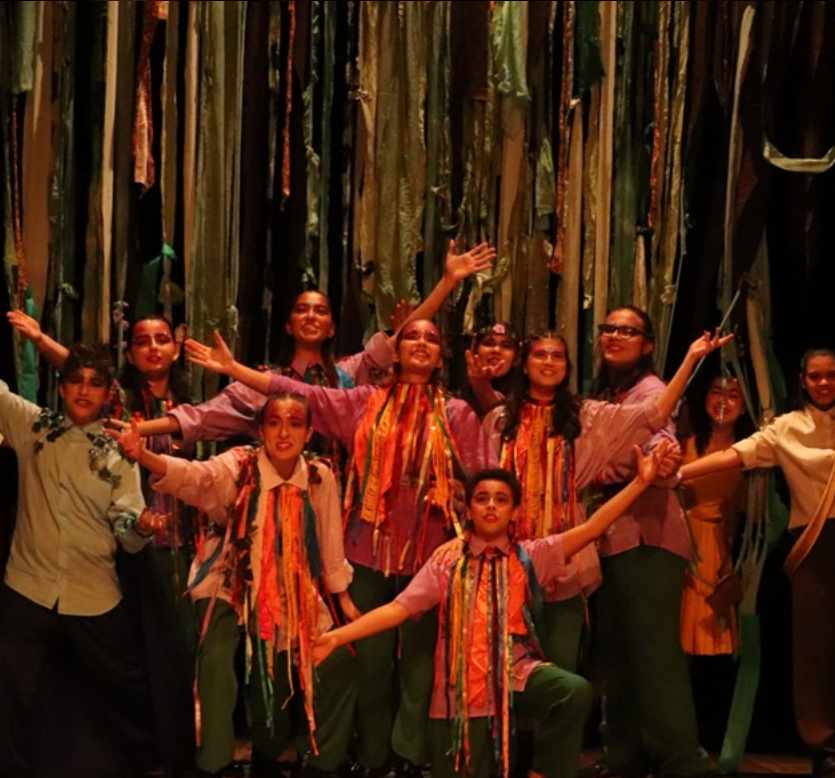
"Sonho", da Trupe Vagalume (Santos/SP) - Categoria Mirim