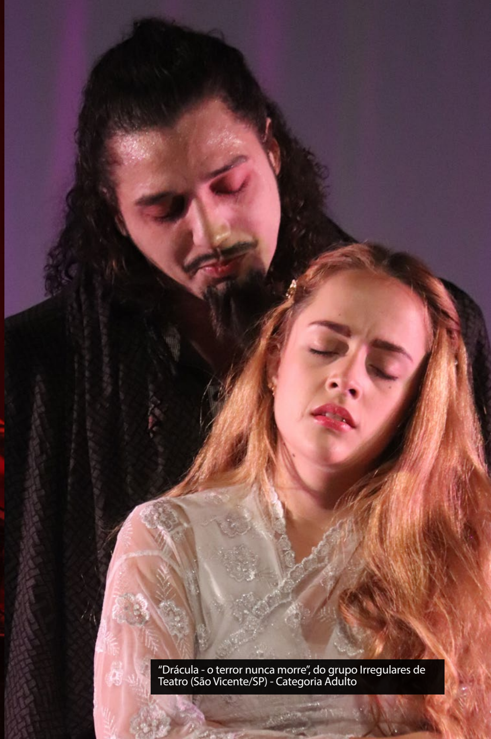
"Drácula - o terror nunca morre", do grupo Irregulares de Teatro (São Vicente/SP) - Categoria Adulto