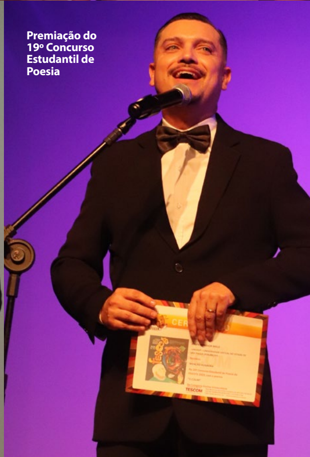
Premiação do 19º Concurso Estudantil de Poesia