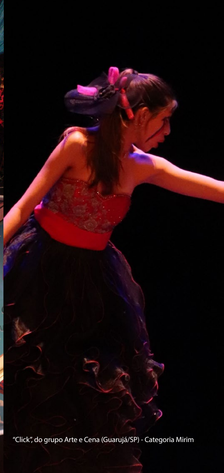
"Click", do grupo Arte e Cena (Guarujá/SP) - Categoria Mirim