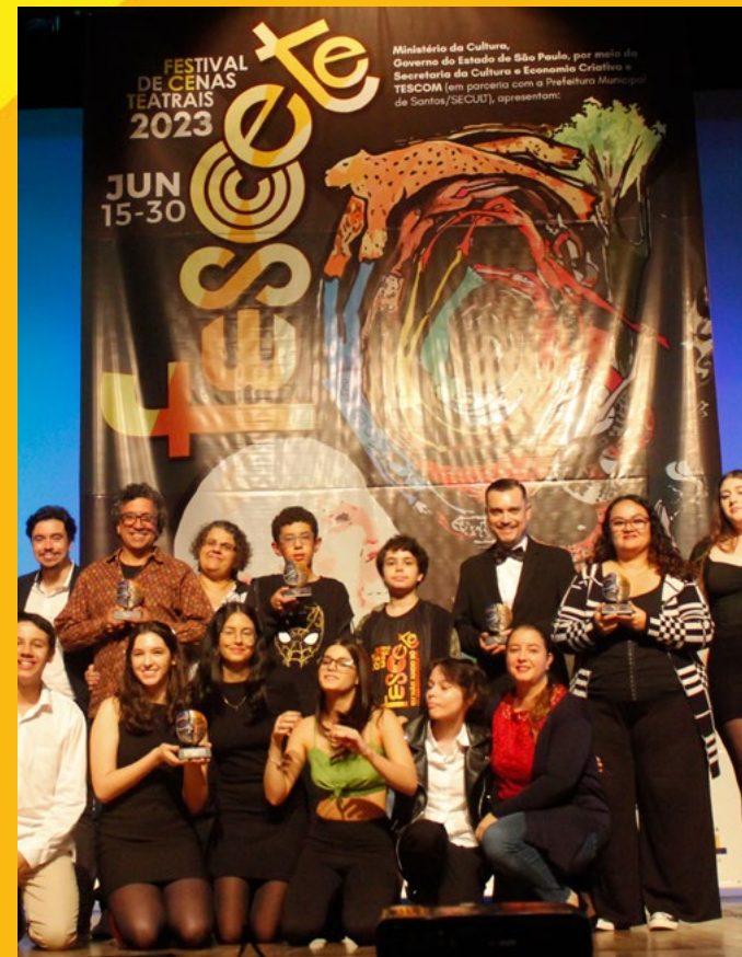
Super Banner (Teatro Brás Cubas) 420x600cm. Super Banner (Teatro Guarany) 214x300cm. E 15 banners de evento com 200x141cm