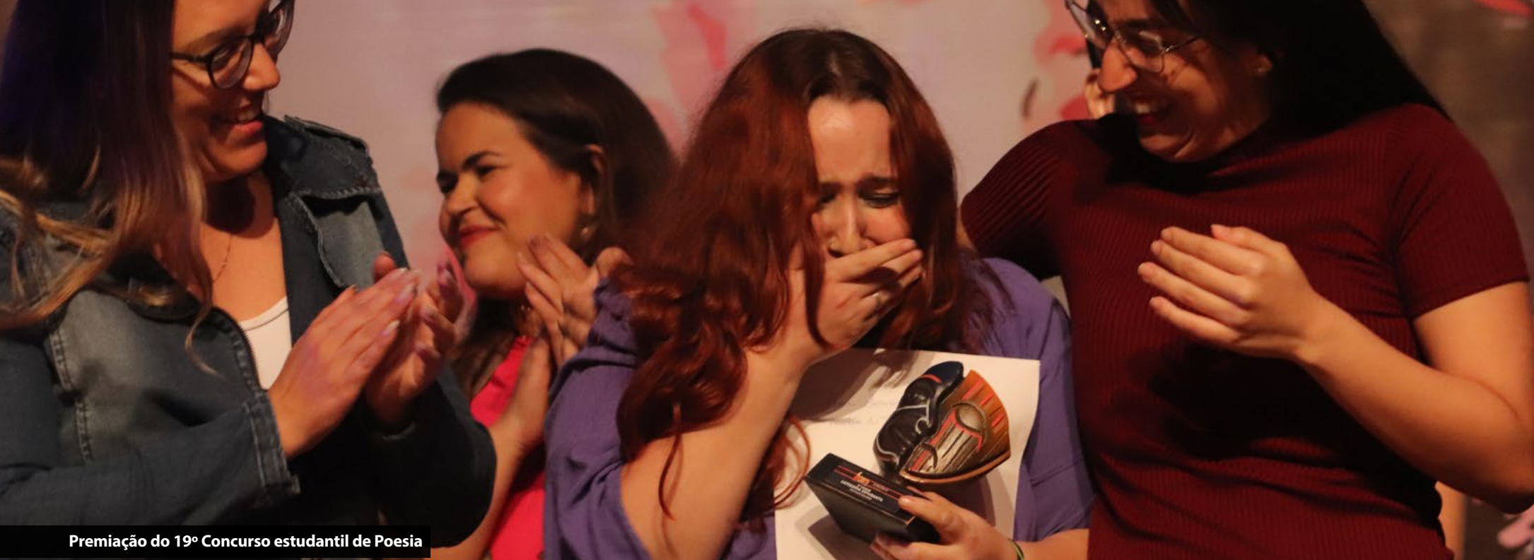
Premiação do 19º Concurso estudantil de Poesia