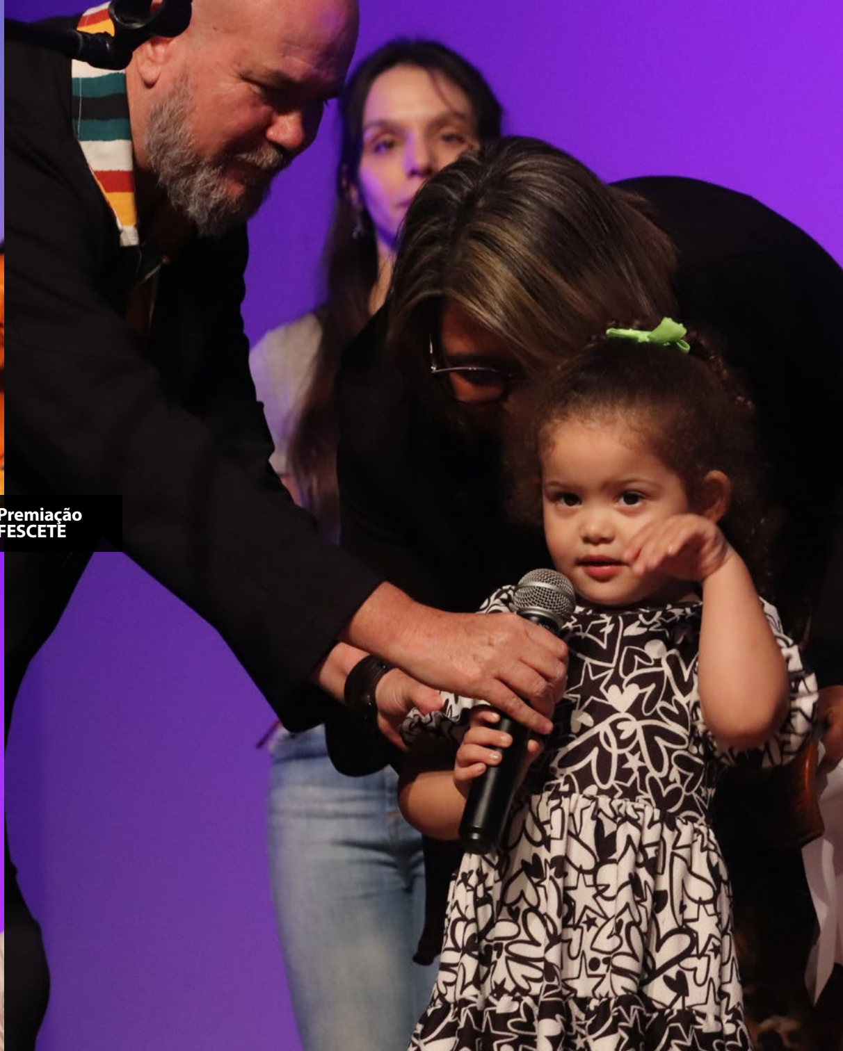
Noite de Premiação do 27º FESCETÉ