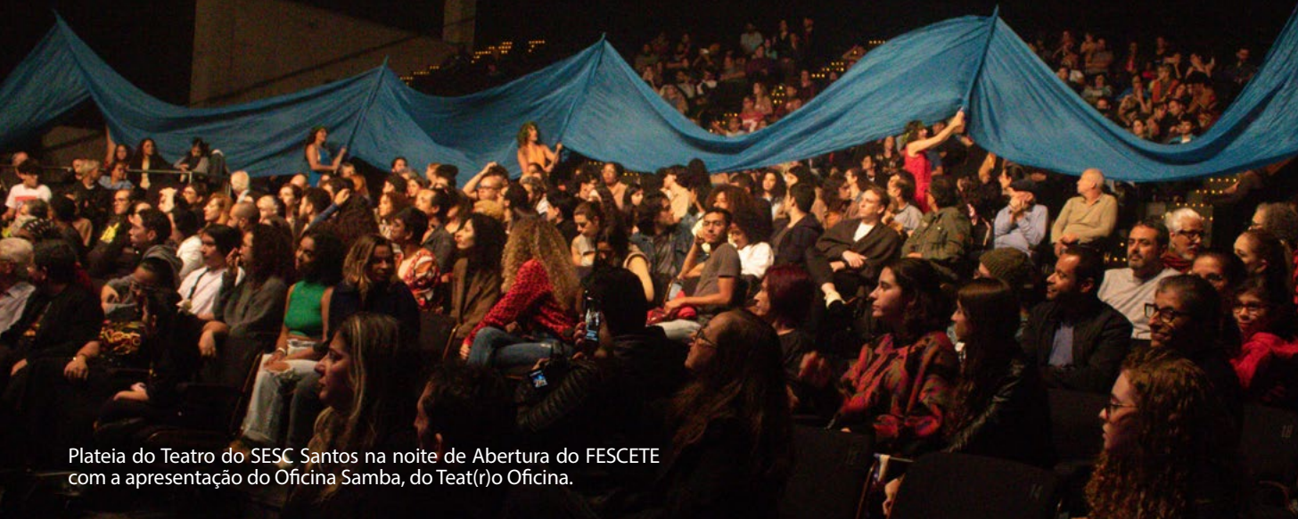
Plateia do Teatro do SESC Santos na noite de Abertura do FESCETE com a apresentação do Oficina Samba, do Teat(r)o Oficina.