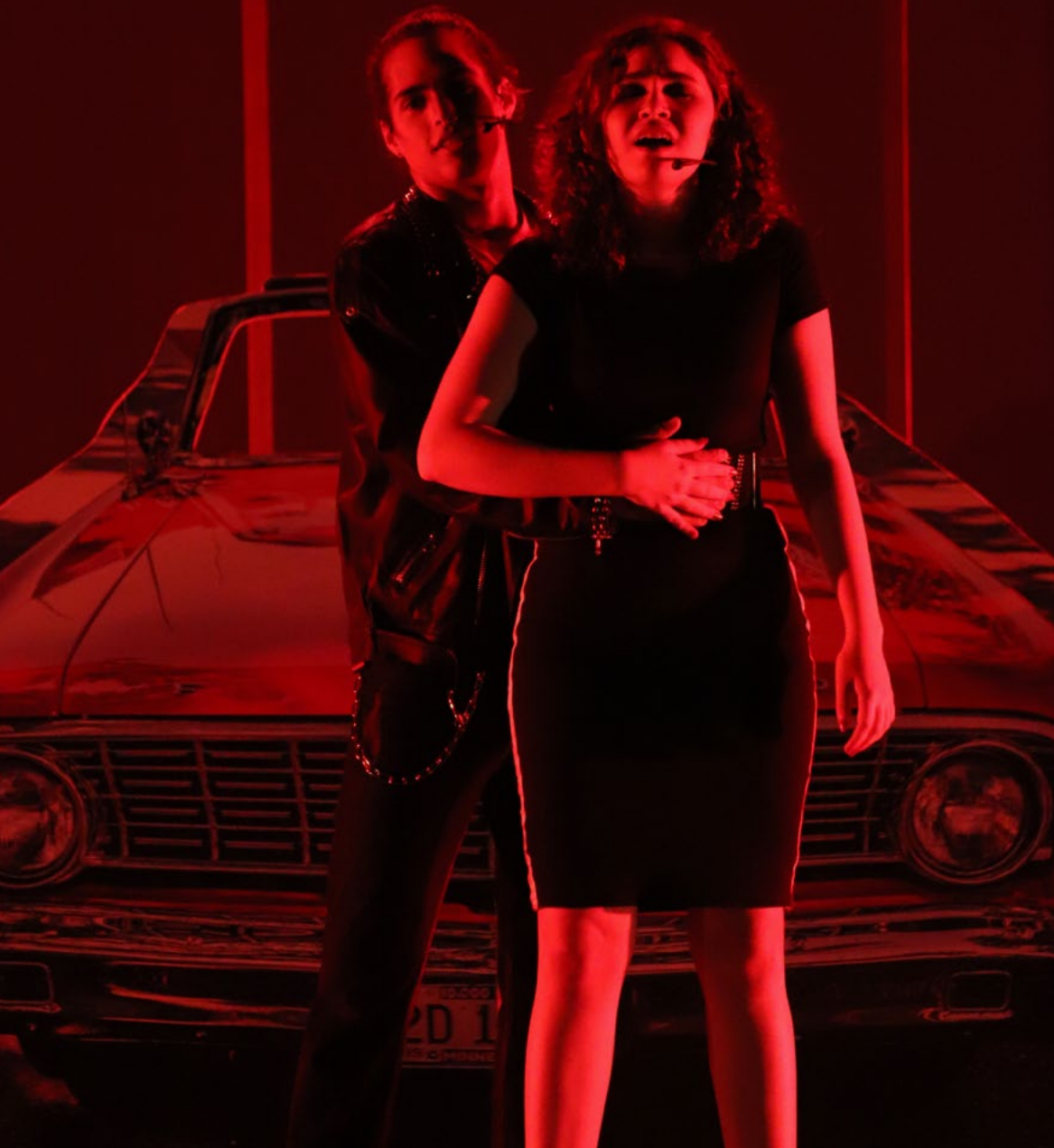
"Grease - o musical: não dá pra priorar", do Grupo drama de Segunda (Santos/ SP) - Categoria Estudantil B