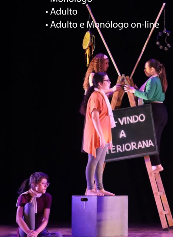
"A Máquina", do Núcleo de Pesquisa em Teatro Musical (Santos/SP) - Categoria Adulto