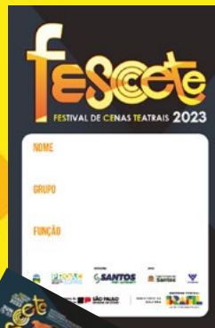
2.000 Crachás de identificação impressos