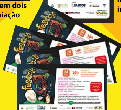
13.100 Ingressos impressos para 38 apresentações.