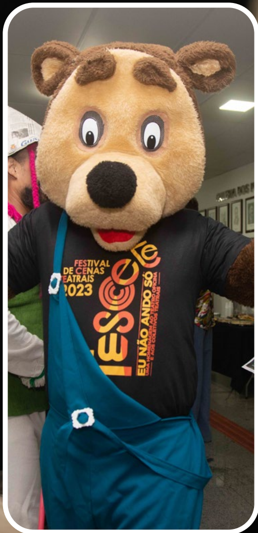
PRÉ-LANÇAMENTO DO FESCETE NA CÂMARA DOS VEREADORES DE SANTOS