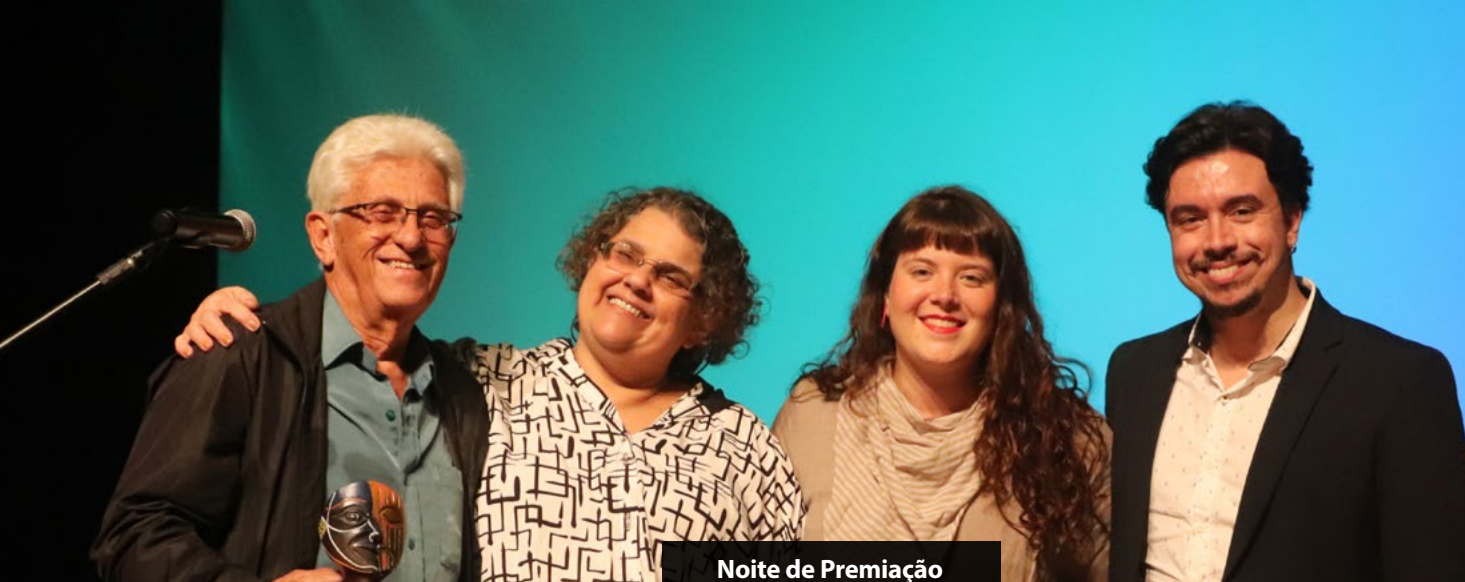
Noite de Premiação do 27º FESCETÊ