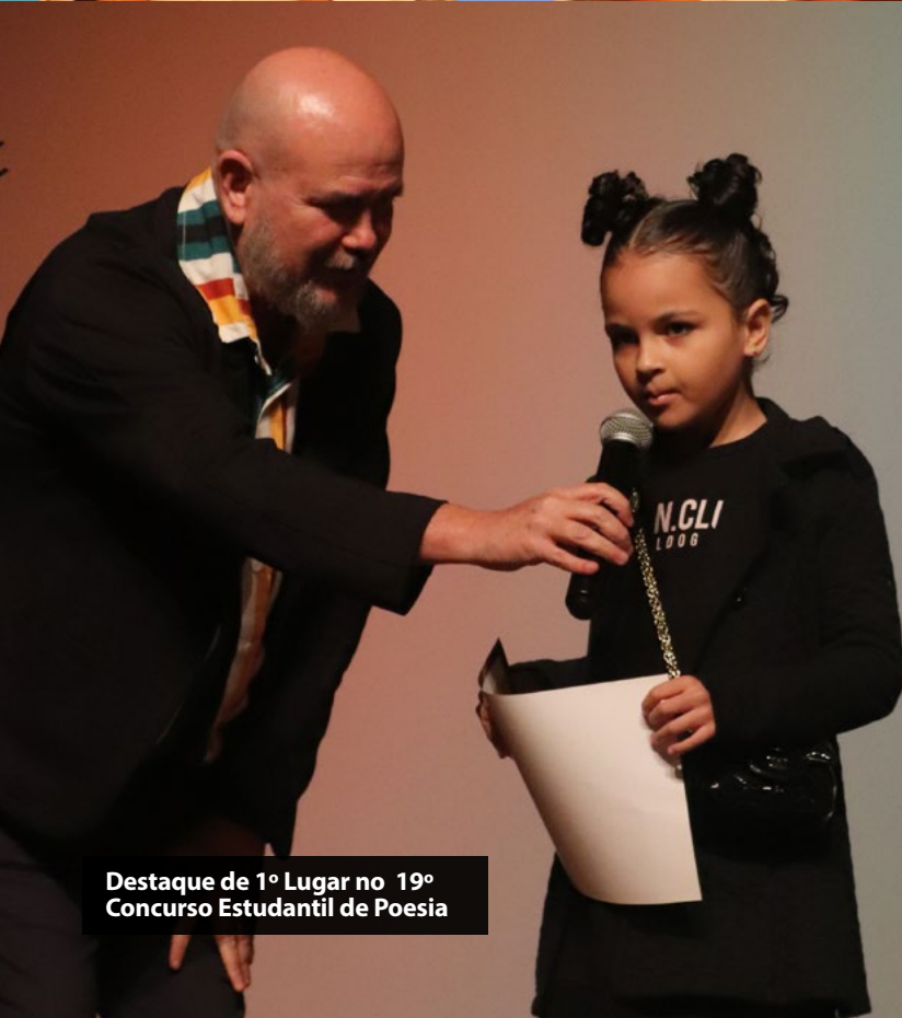
Destaque de 1º Lugar no 19º Concurso Estudantil de Poesia