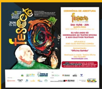
1.000 Convites de Abertura impressos e 5.000 digitais por mailing