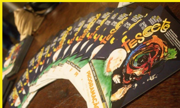
3.000 Livretos de Programação impressos