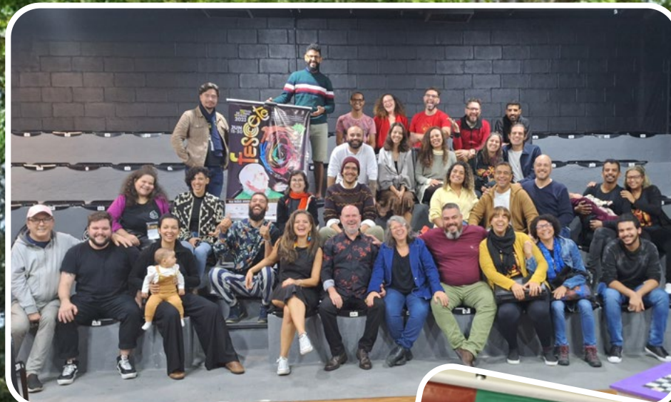
Encontro de Coletivos com o Grupo TESCOM (Santos/SP), Teatro de Retalhos (Arcoverde/PE), Coletivo 302 (Cubatão/SP) e ATeliê voadOR Teatro (Salvador/BA)