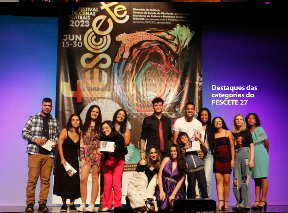
Destaques das categorias do FESCTE 27