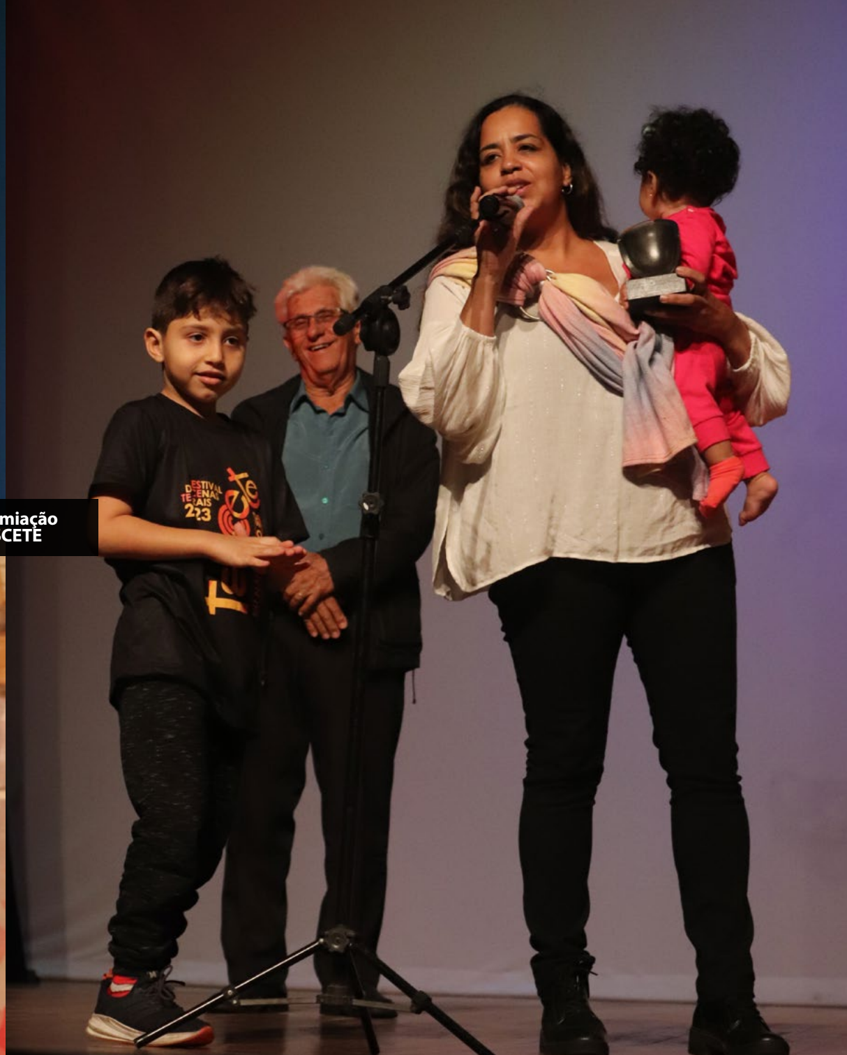
Noite de Premiação do 27º FESCETÉ