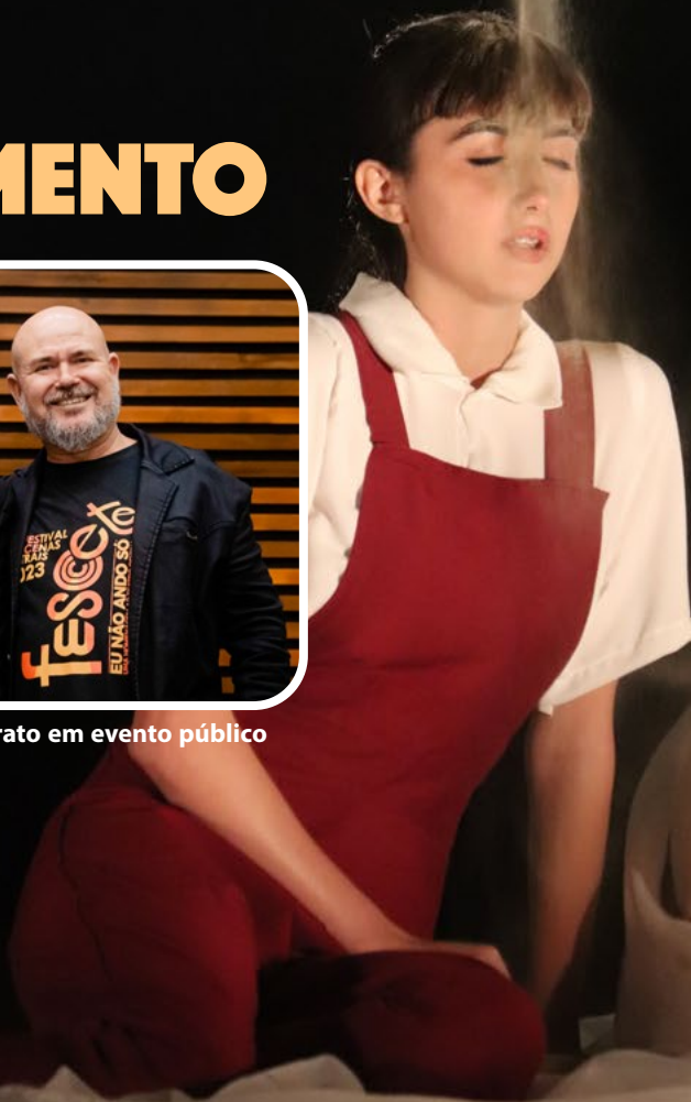
Foto: Cena "Os Desastres De Sofia", do Grupo Sete, Oito... Valendo! (Santos/SP)