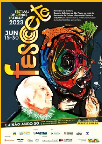
800 Cartazes A3 impressos