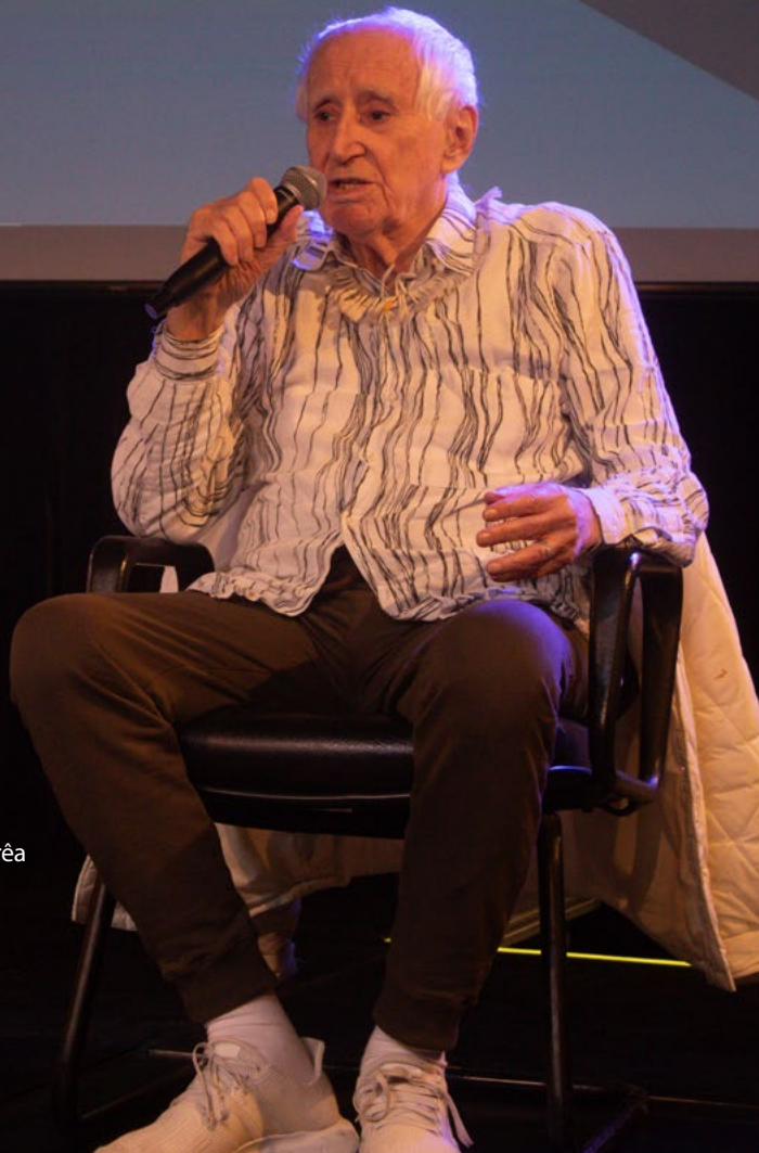
José Celso Martinez Corrêa