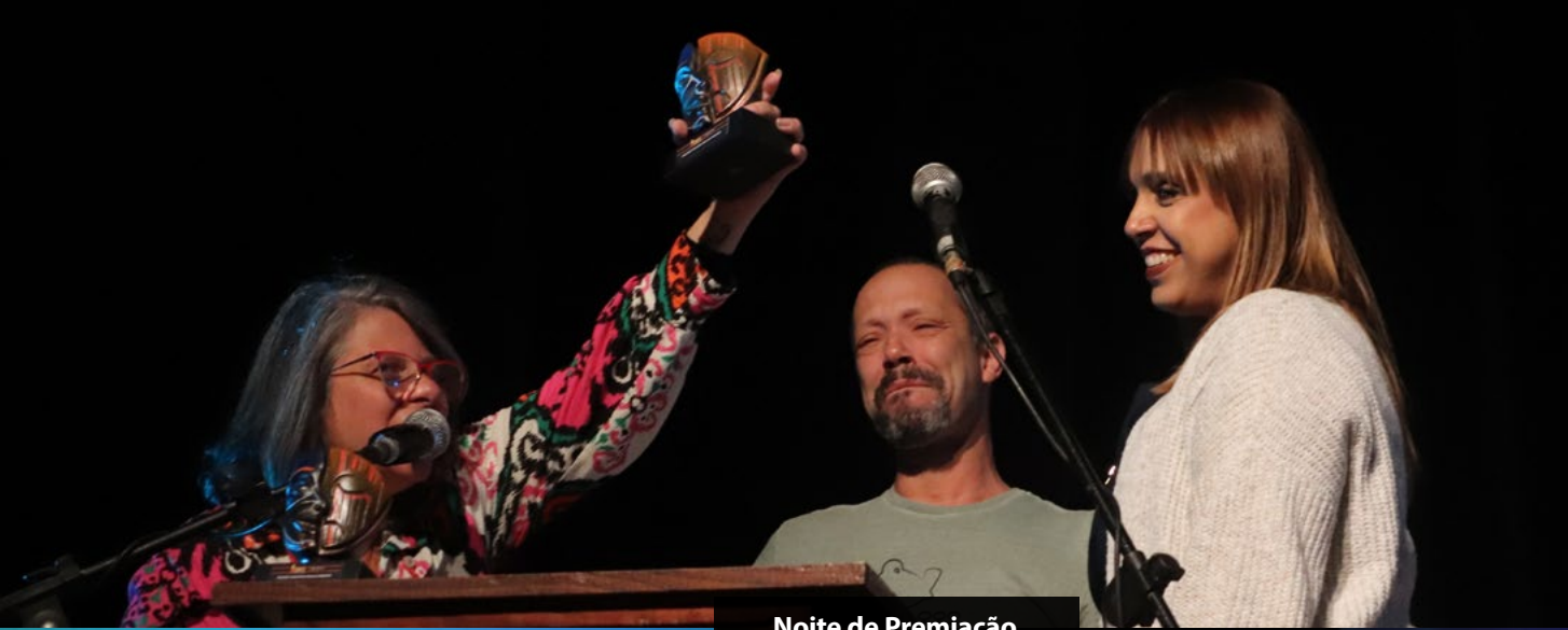
Noite de Premiação do 27º FESCETÉ