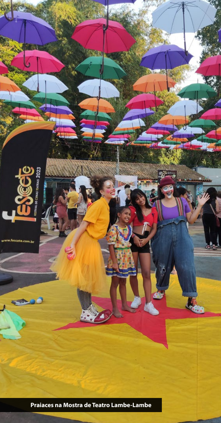
Praiares na Mostra de Teatro Lambe-Lambe