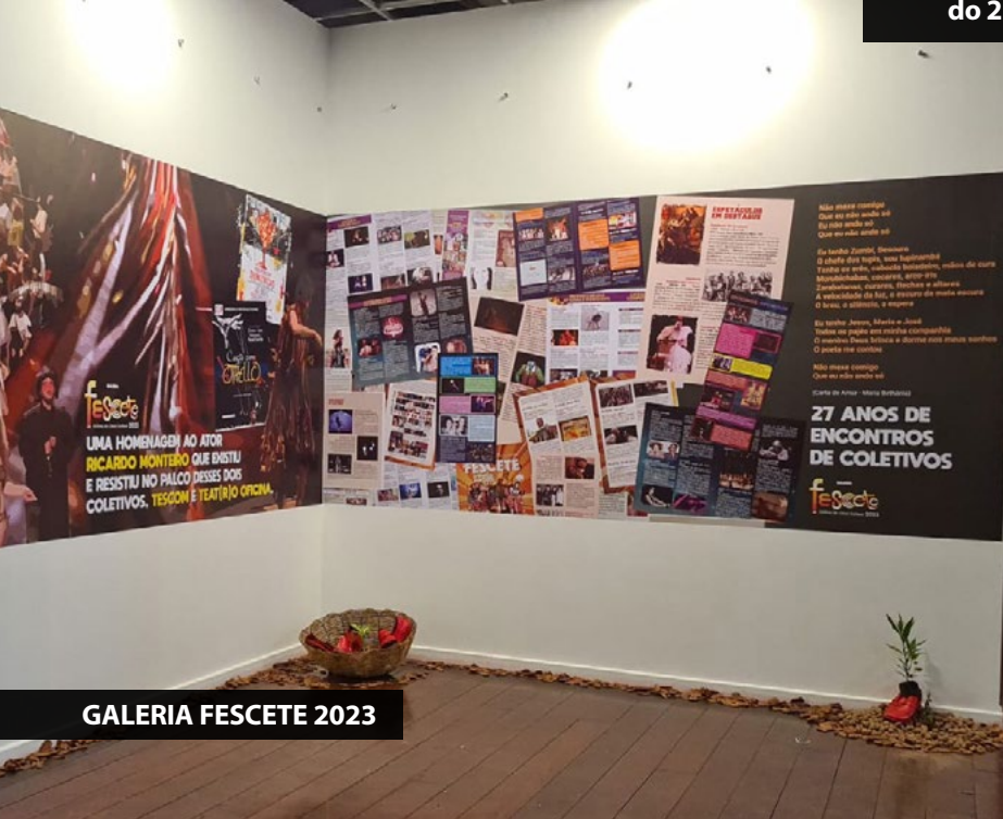
GALERIA FESCETE 2023