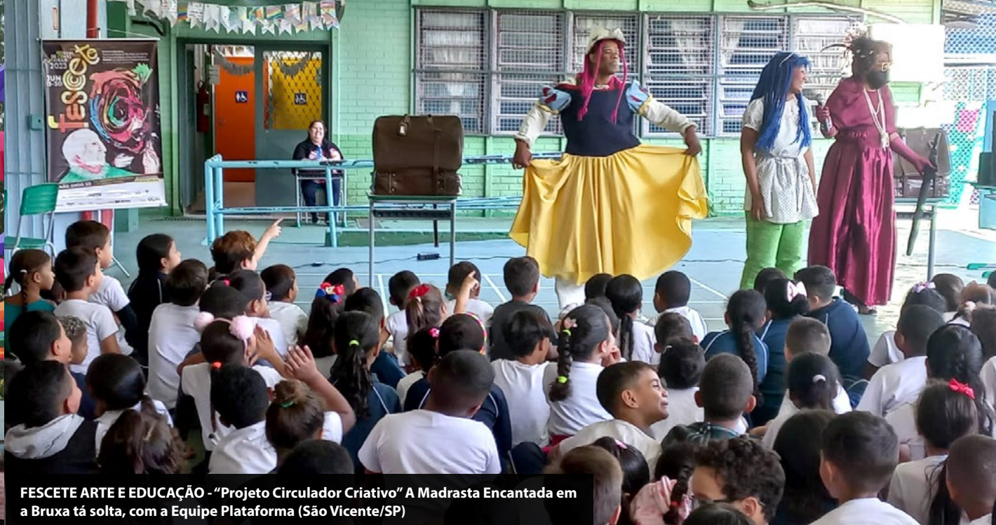
FESQUETE ARTE E EDUCAÇÃO - "Projeto Circulador Criativo" A Madrasta Encantada em a Bruxa tá solta, com a Equipe Plataforma (São Vicente/SP)