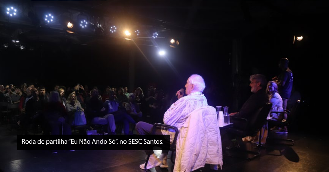
Roda de partilha "Eu Não Ando Só", no SESC Santos.