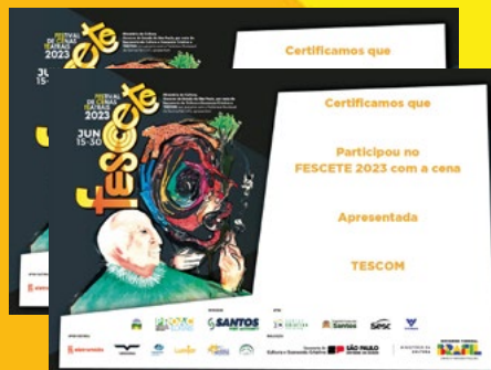
2.200 Certificados impressos em dois modelos, participação e premiação