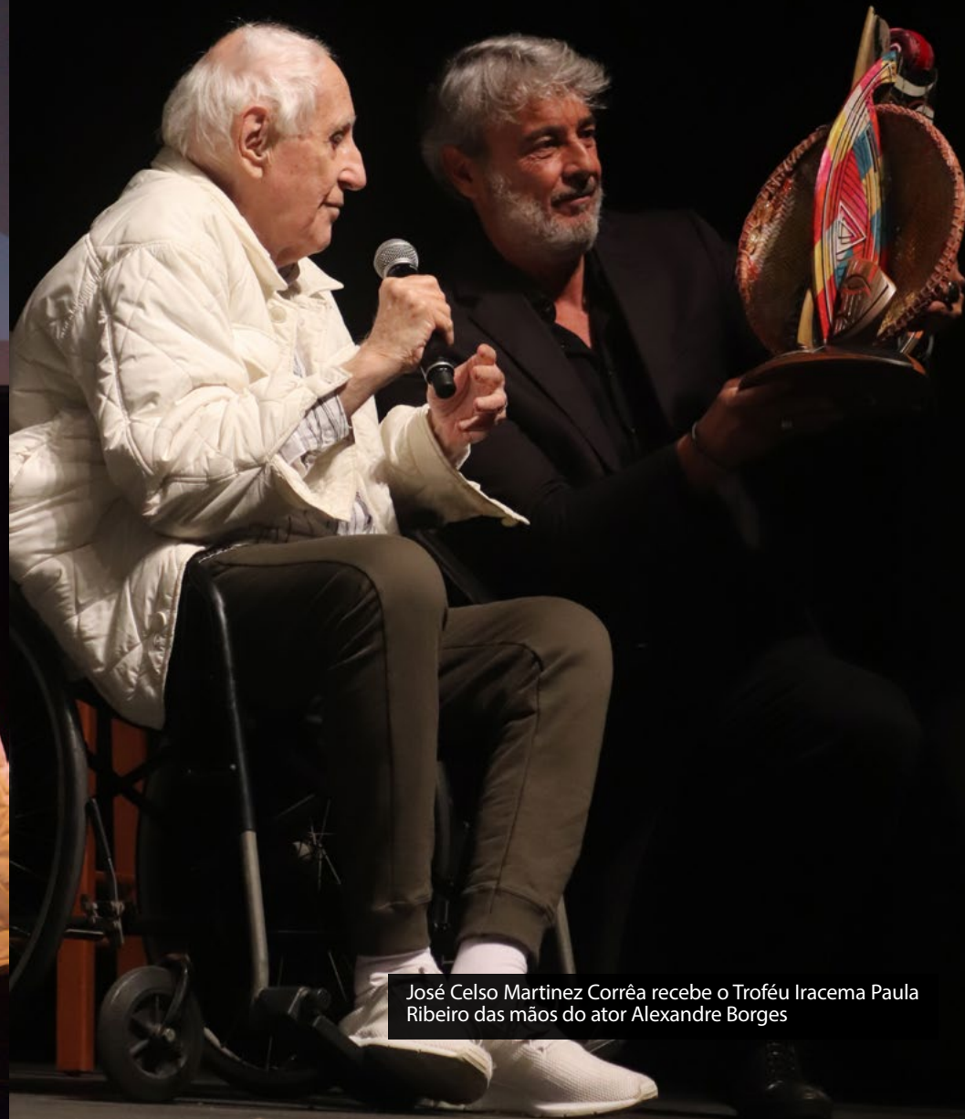
José Celso Martinez Corrêa recebe o Troféu Iracema Paula Ribeiro das mãos do ator Alexandre Borges