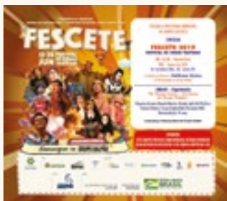
1.000 Convites de abertura impressos e 5.000 digitais por mailing