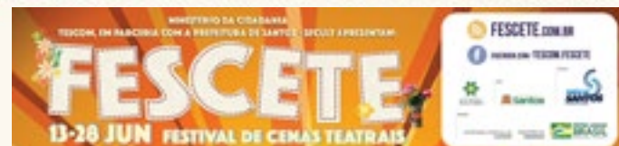
10 Faixas de Rua 300x70cm