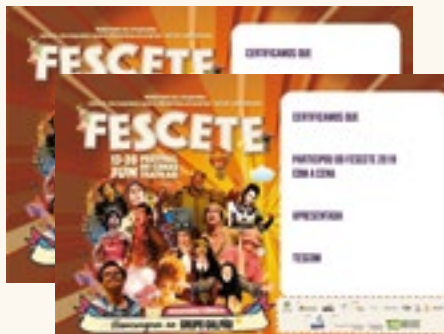
2.200 Certificados impressos em dois modelos, participação e premiação