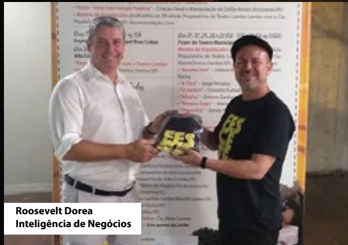
Roosevelt Dorea Inteligência de Negócios