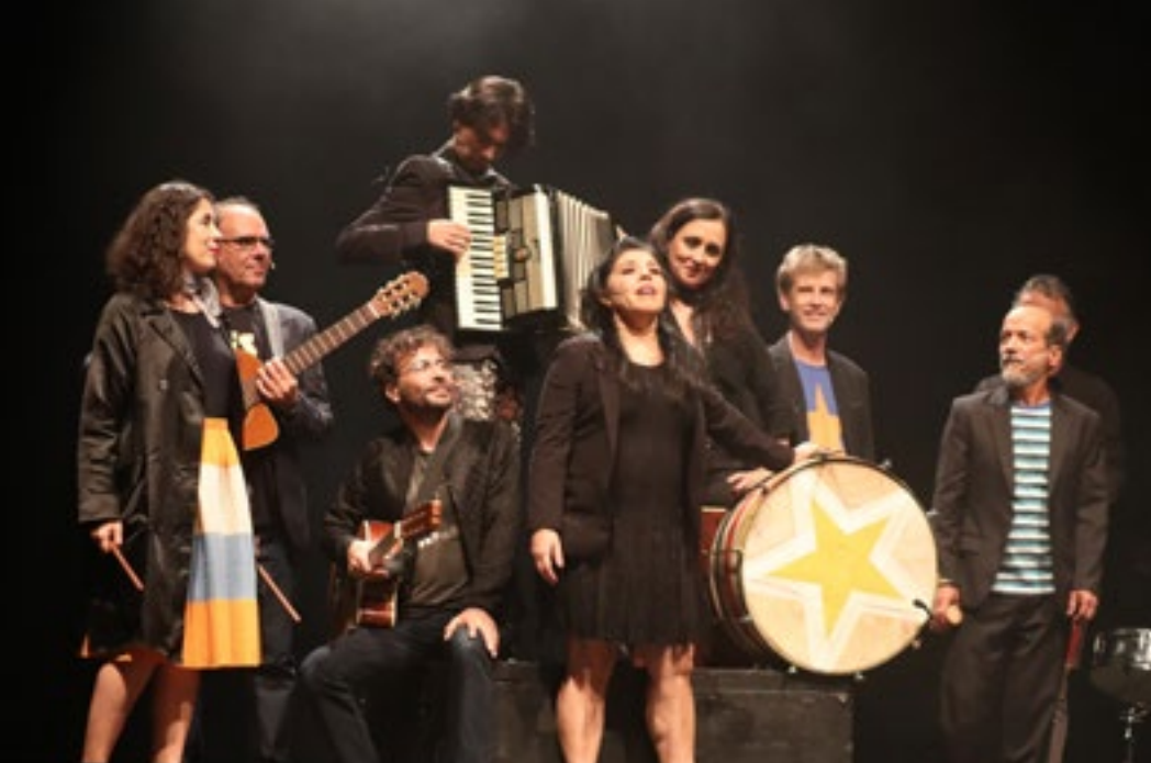
Foto 1: Espetáculo "De Tempo Somos - um sarau do Grupo Galpão", do Grupo Galpão (Belo Horizonte/MG)