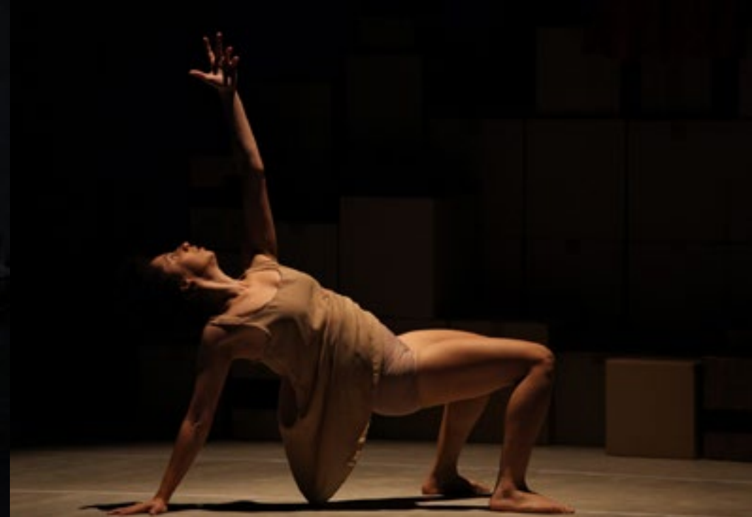
Foto 1: Roda de Partilha da Categoria Estudantil A, na TESCOM Escola de Teatro. Foto 2: Espetáculo "O Suicídio Mais Bonito do Mundo", Direção Fabiano Di Melo (Cubatão/SP) Foto 3: Roda "Capoeira para Todos", com o Projeto Capoeira Escola Mestre Márcio (Santos /SP)