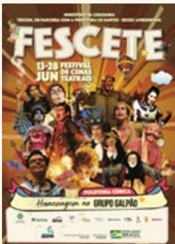
800 Cartazes A3 impressos