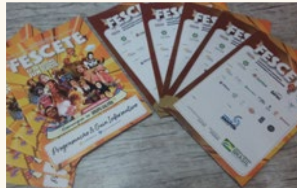
3.000 Livretos de Programação impressos