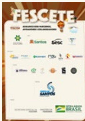
10 Banner dos Apoiadores