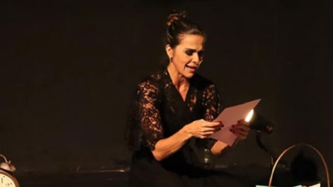
Foto 1: Espetáculo "Uma Mulher Impossível", com a ATeliê voadOR Companhia de Teatro (Salvador/BA) Foto 2: Espetáculo "Sonho de uma noite de verão", com o Núcleo de Teatro Musical (Santos/SP) Foto 3: Espetáculo "Fountainbleau", da Bella Cia. (São Paulo/SP) Foto 4: Espetáculo "Resíduos", Direção Dario Félix (Santos/SP)