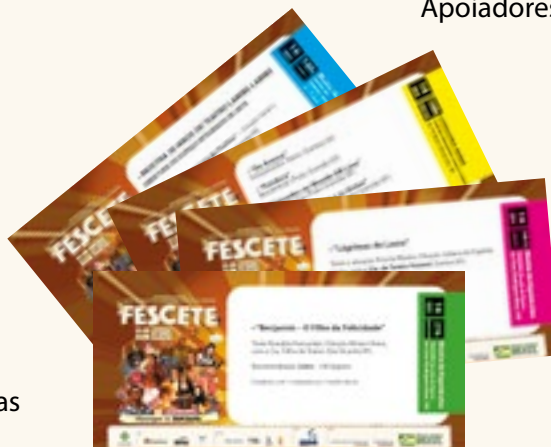
13.100 Ingressos impressos para 38 apresentações.