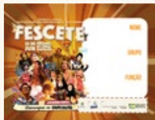
2.000 Crachás de identificação impressos