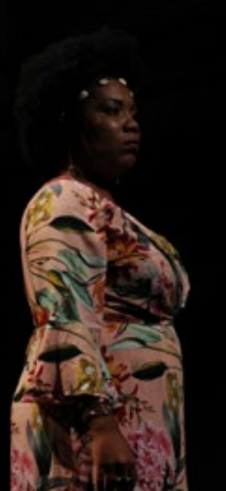
Espetáculo Lágrimas de Laura, da Cia de Teatro Vozavó (Santos-SP)