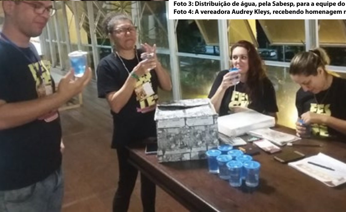
Foto 3: Distribuição de água, pela Sabesp, para a equipe do Festival.