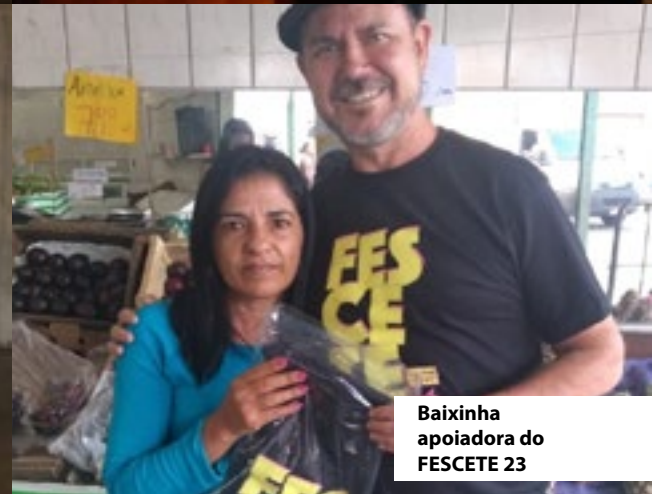
Baixinha apoiadora do FESCETE 23