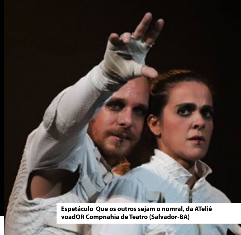
Espetáculo Que os outros sejam o normal, da ATeliê voadOR Companhia de Teatro (Salvador-BA)