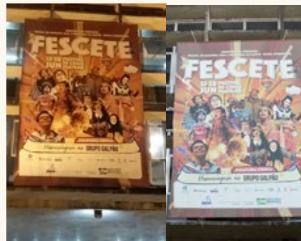
Super Banner (Teatro Brás Cubas) 420x600cm. Super Banner (Teatro Guarany) 214x300cm. E 15 banners de evento com 200x141cm