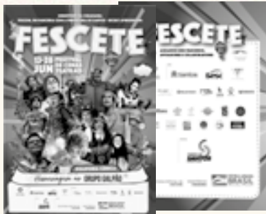
15.000 Flyers PB impressos A5