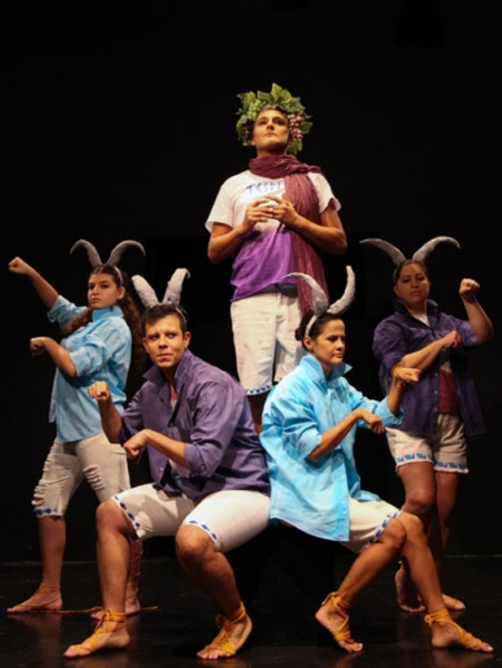
Aula-espetáculo História do Teatro Parte 1 - Grécia, com o Grupo Arte e Estudo (Santos-SP), na TESCOM Escola de Teatro