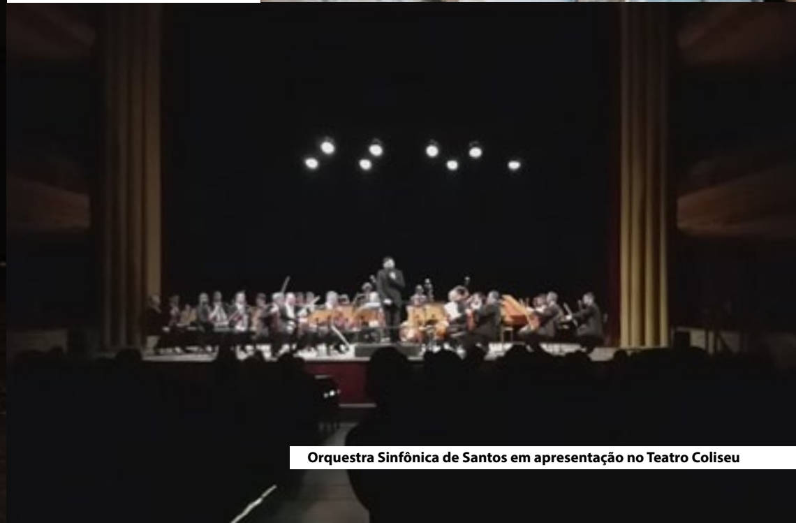
Orquestra Sinfônica de Santos em apresentação no Teatro Coliseu