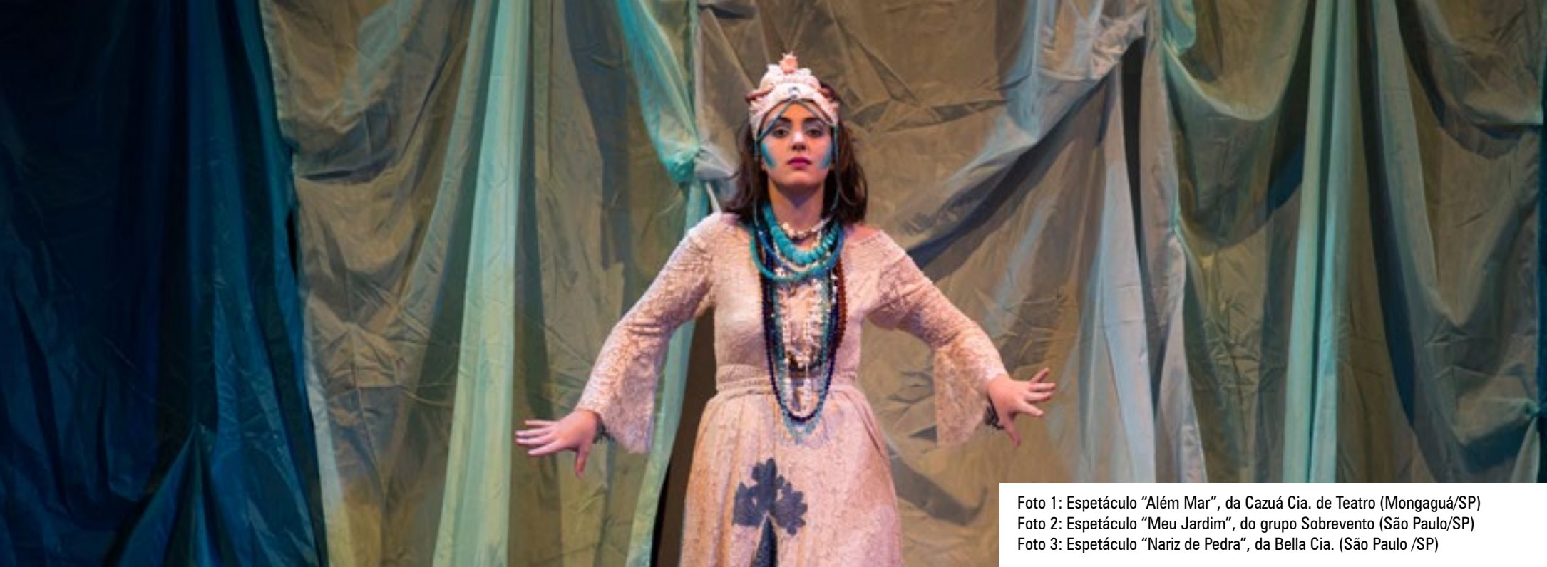
Foto 1: Espetáculo "Além Mar", da Cazuá Cia. de Teatro (Mongaguá/SP) Foto 2: Espetáculo "Meu Jardim", do grupo Sobrevento (São Paulo/SP) Foto 3: Espetáculo "Nariz de Pedra", da Bella Cia. (São Paulo /SP)