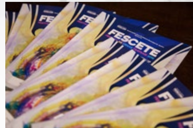
3.000 Livretos de Programação impressos