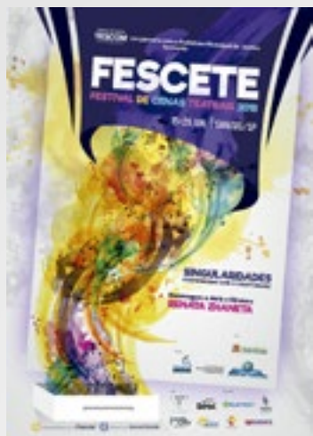
800 Cartazes A3 impressos