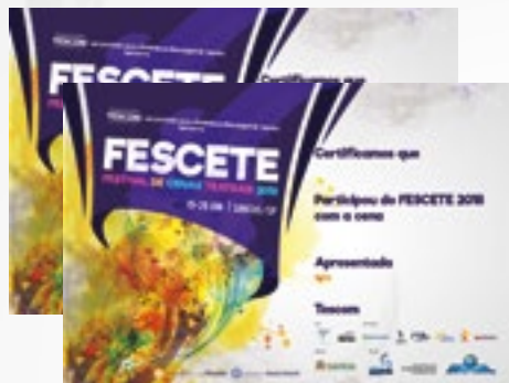
2.200 Certificados impressos em dois modelos, participação e premiação