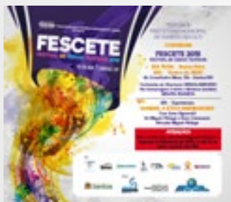
1.000 Convites de abertura impressos e 5.000 digitais por mailing