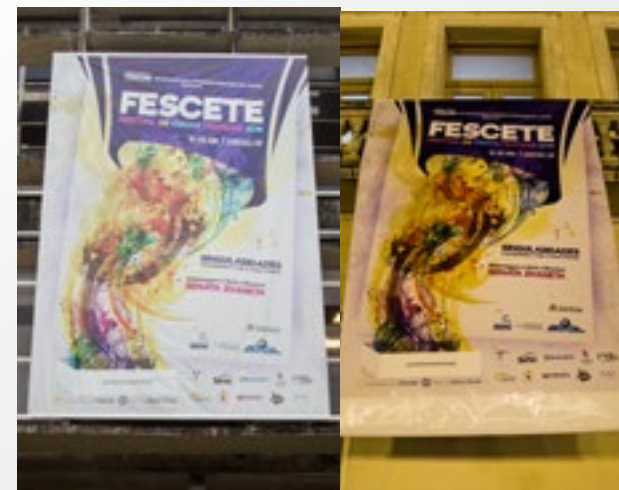
Super Banner (Teatro Brás Cubas) 420x600cm. Super Banner (Teatro Guarany) 214x300cm. E 15 banners de evento com 200x141cm