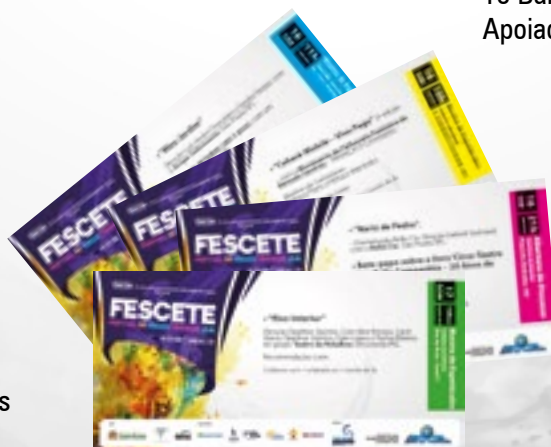
13.100 Ingressos impressos para 38 apresentações.