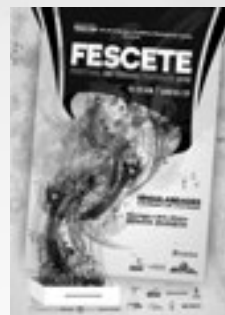
15.000 Flyers PB impressos A5