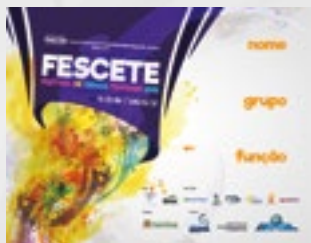
2.000 Crachás de identificação impressos