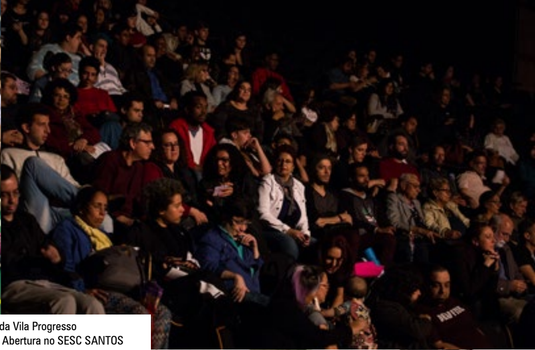
Foto 1: Público na Vila Criativa da Vila Progresso Foto 2: Público na Cerimônia de Abertura no SESC SANTOS Foto 3: Público na TESCOM | Escola de Teatro Foto 4: Roda de Partilha da Categoria Mirim – Foyer do Teatro Municipal