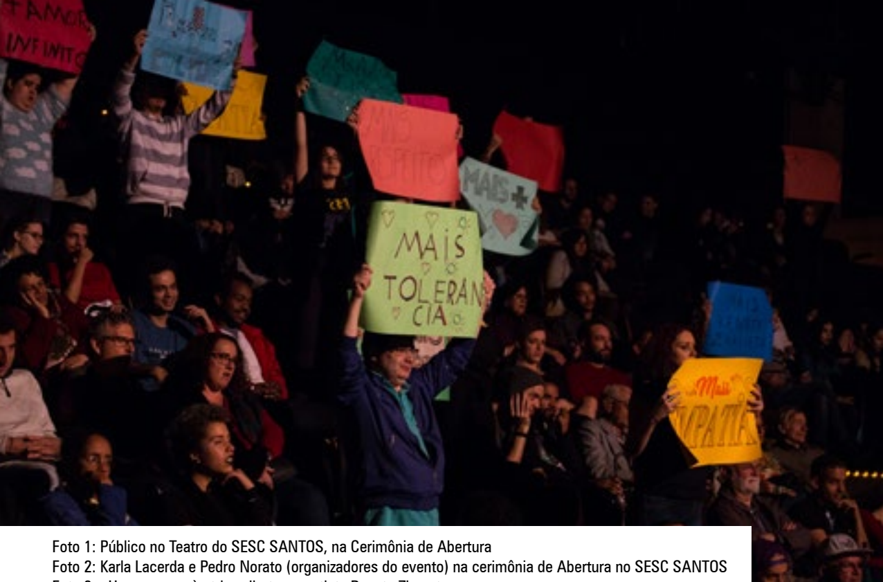
Foto 1: Público no Teatro do SESC SANTOS, na Cerimônia de Abertura