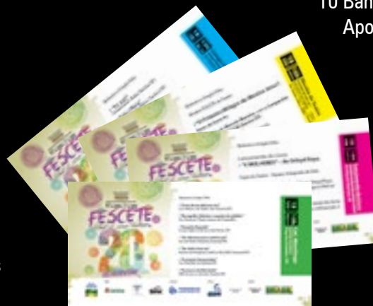
8.000 Ingressos impressos para 38 apresentações.