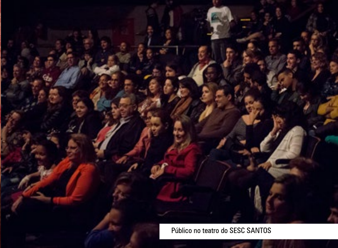
Público no teatro do SESC SANTOS