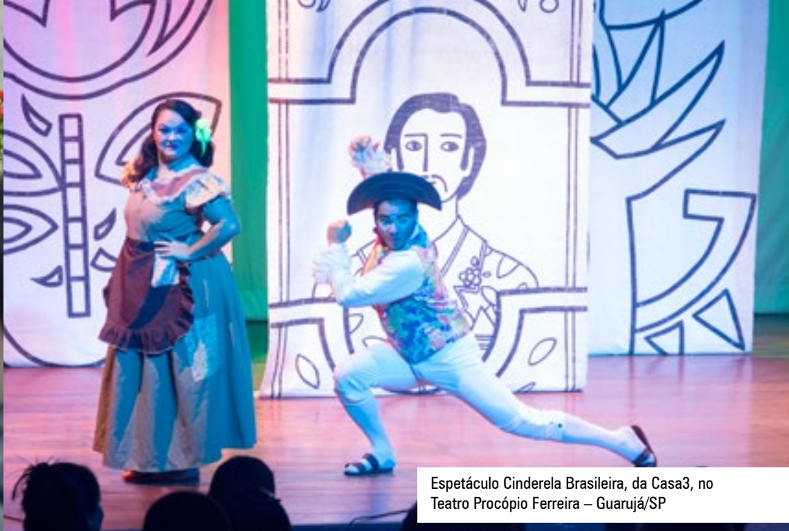
Espectáculo Cinderela Brasileira, da Casa3, no Teatro Procópio Ferreira – Guarujá/SP