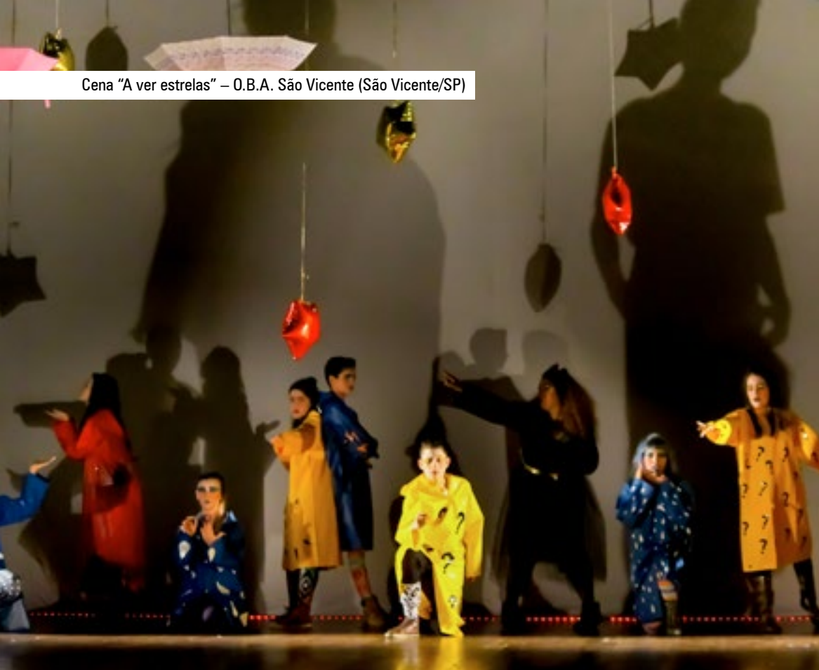
Cena "A ver estrelas" – O.B.A. São Vicente (São Vicente/SP)