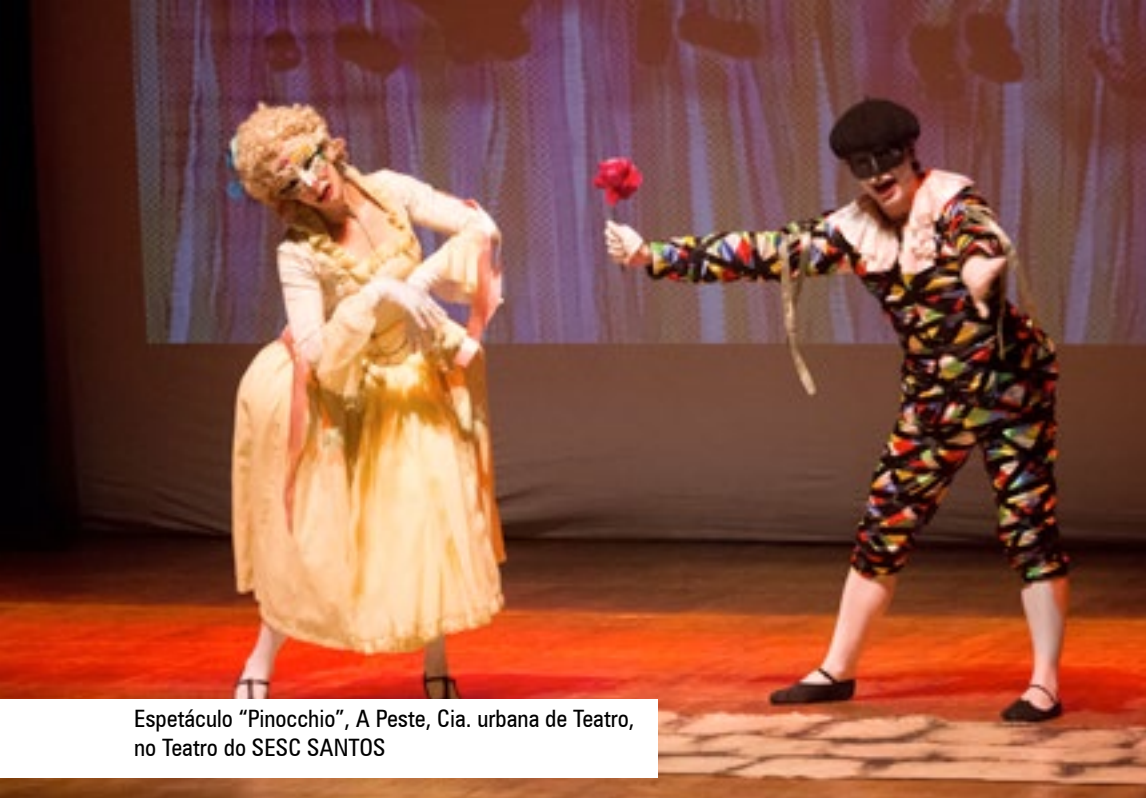
Espectáculo "Pinocchio", A Peste, Cia. urbana de Teatro, no Teatro do SESC SANTOS