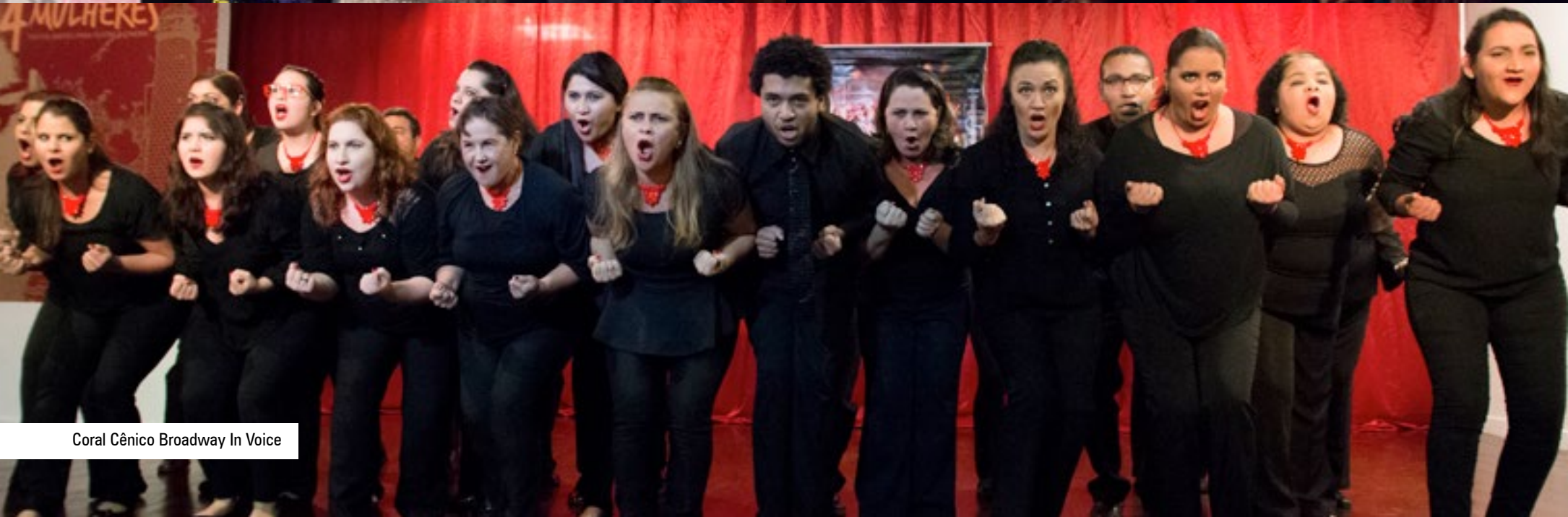
Coral Cênico Broadway In Voice