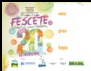
1.200 Crachás de identificação impressos