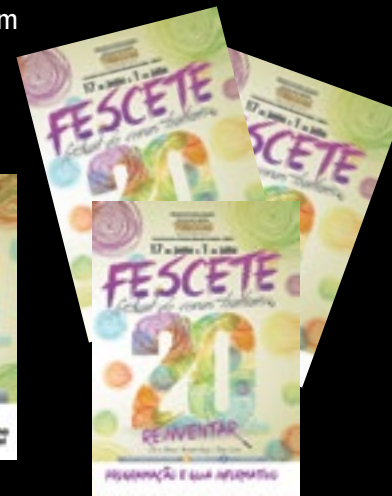
3.000 Livretos de Programação impressos