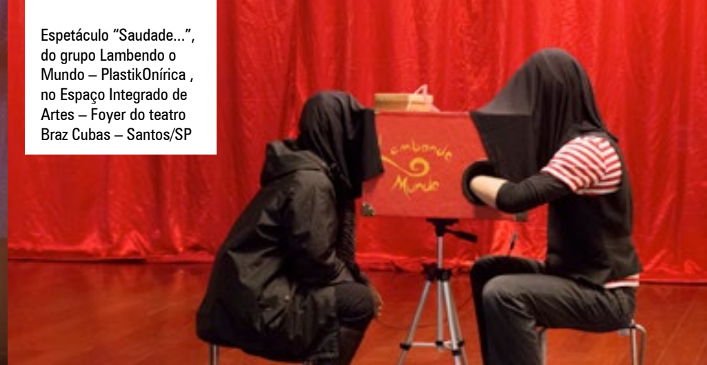
Espectáculo "Saúde...", do grupo Lambendo o Mundo – PlastikOnírica, no Espaço Integrado de Artes – Foyer do teatro Braz Cubas – Santos/SP