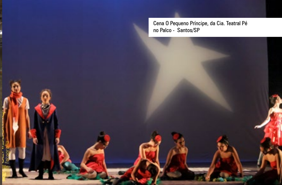
Cena O Pequeno Príncipe, da Cia. Teatral Pé no Palco - Santos/SP