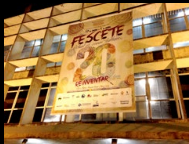
Super Banner para os teatros 420x600cm. E 10 banners de evento com 200x141cm