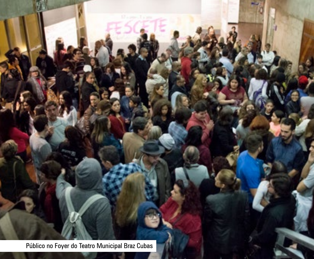
Público no Foyer do Teatro Municipal Braz Cubas