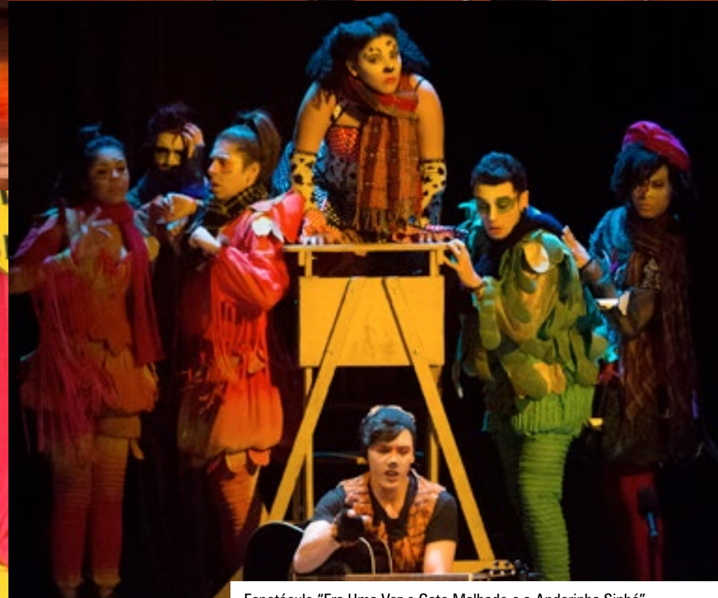
Espectáculo "Era Uma Vez o Gato Malhado e a Andorinha Sinhá", do Coletivo Verum de Teatro, no Teatro Guarany – Santos/SP