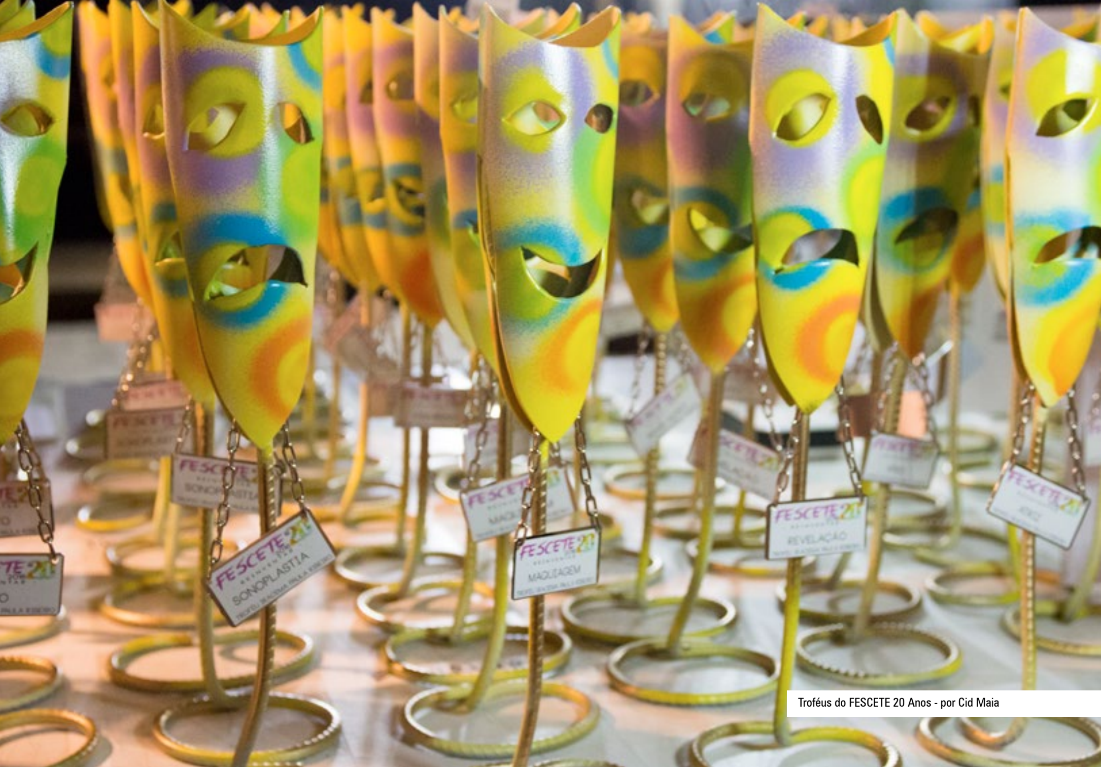
Troféus do FESCETE 20 Anos - por Cid Maia