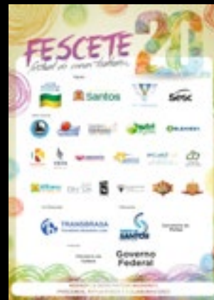
10 Banner dos Apoiadores