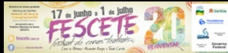
10 Faixas de Rua 300x70cm