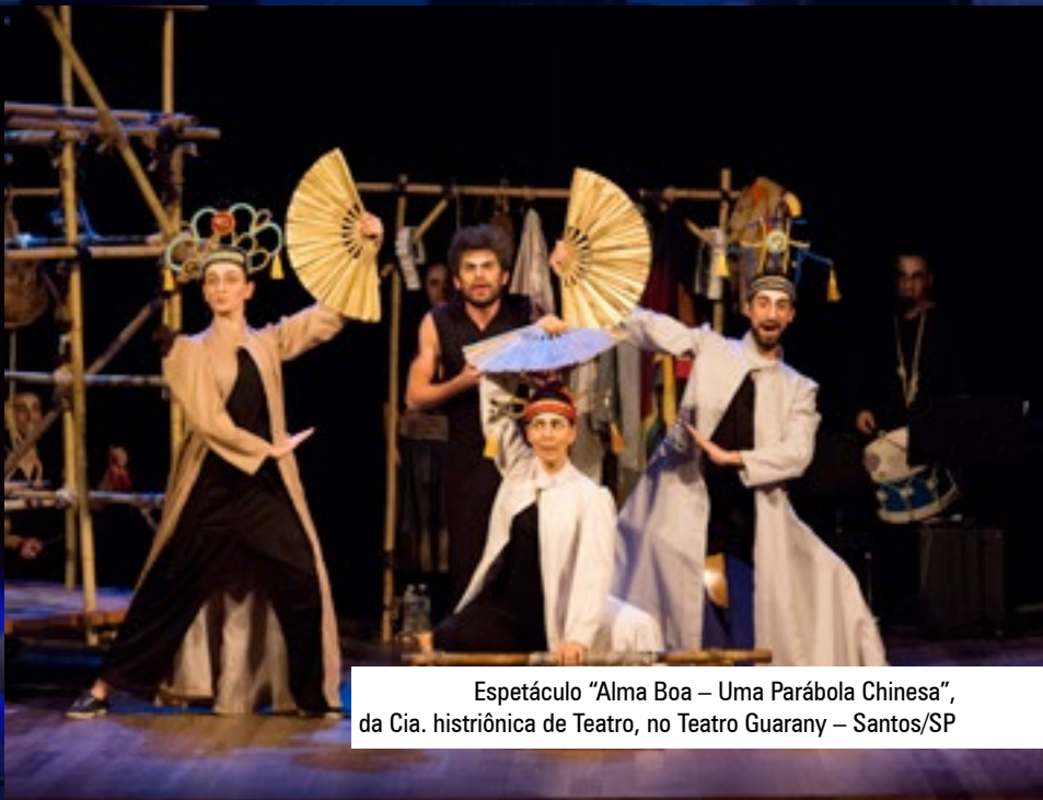
Espectáculo "Alma Boa – Uma Parábola Chinesa", da Cia. histriônica de Teatro, no Teatro Guarany – Santos/SP