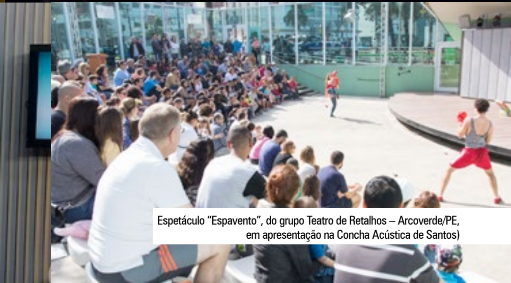
Espectáculo "Espavento", do grupo Teatro de Retalhos – Arcoverde/PE, em apresentação na Concha Acústica de Santos