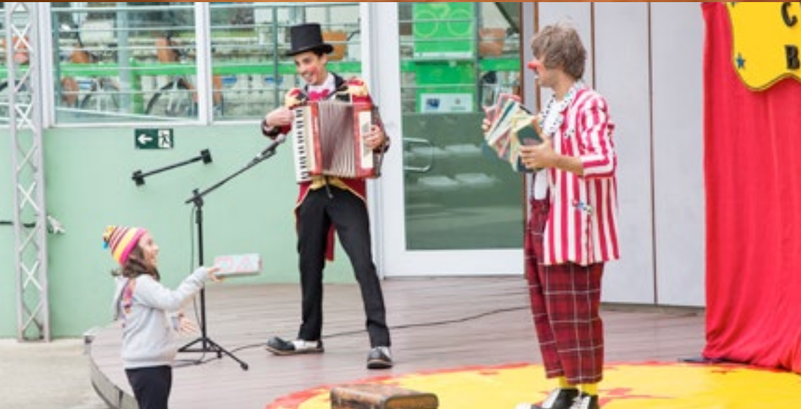
Espectáculo "Circo Bella", da Bella Cia., na Concha Acústica – Santos/SP