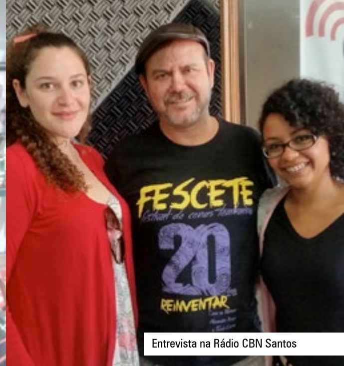
Entrevista na Rádio CBN Santos