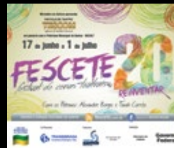
Anúncios Impressos no jornal A Tribuna