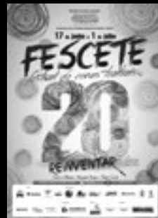
20.000 Flyers PB impressos A5