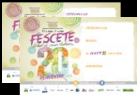
1.350 Certificados impressos em dois modelos, participação e premiação