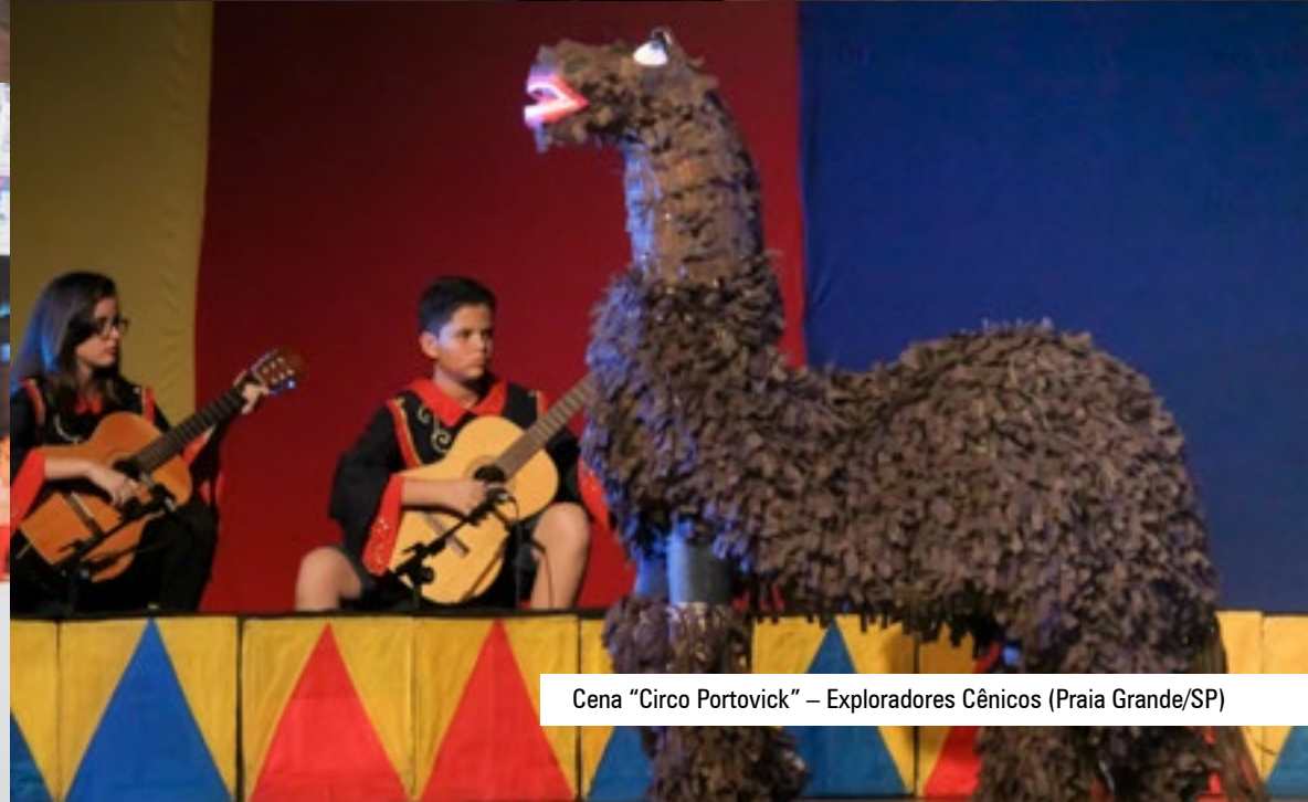
Cena "Circo Portovick" – Exploradores Cênicos (Praia Grande/SP)