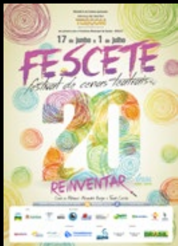
500 Cartazes A3 impressos