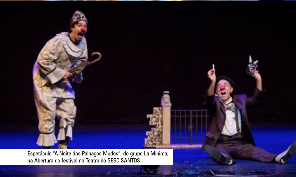
Espectáculo "A Noite dos Palhaços Mudos", do grupo La Mínima, na Abertura do festival no Teatro do SESC SANTOS