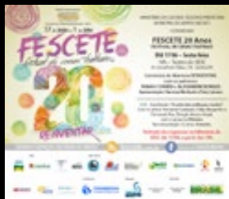
1.000 Convites de abertura impressos e 5.000 digitais por mailing