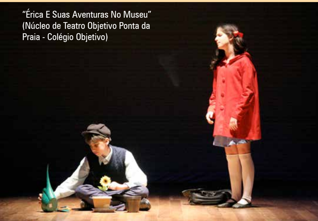
"Érika e Suas Aventuras No Museu" (Núcleo de Teatro Objetivo Ponta da Praia - Colégio Objetivo)