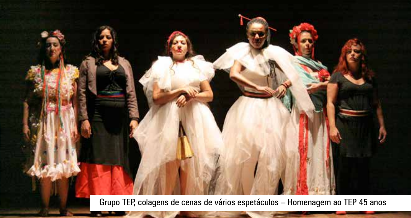
Grupo TEP, colagens de cenas de vários espetáculos – Homenagem ao TEP 45 anos