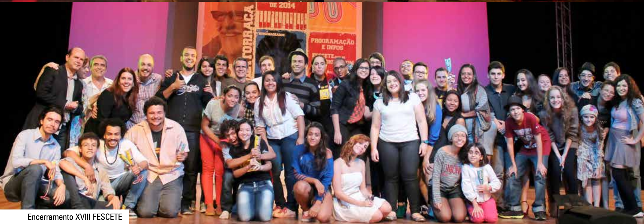
Encerramento XVIII FESCETE