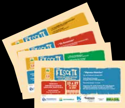
13.000 Ingressos impressos para 30 apresentações.