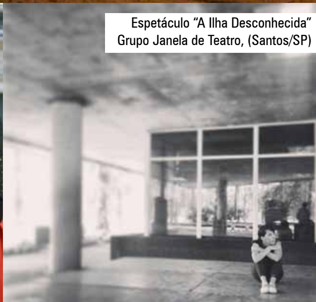
Espectáculo "A Ilha Desconhecida" Grupo Janela de Teatro, (Santos/SP)