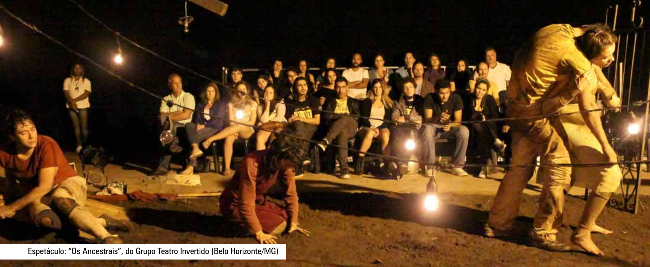
Espectáculo: "Os Ancestrais", do Grupo Teatro Invertido (Belo Horizonte/MG)