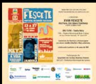
1.500 Convites de abertura impressos e 5.000 digitais por mailing