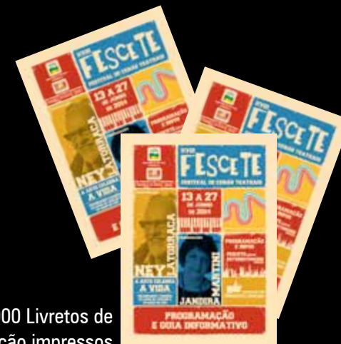
3.000 Livretos de Programação impressos