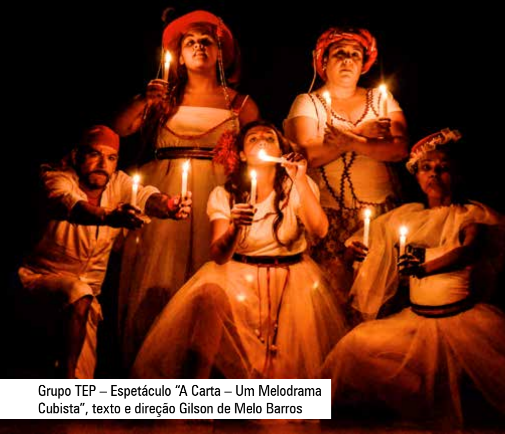
Grupo TEP – Espetáculo “A Carta – Um Melodrama Cubista”, texto e direção Gilson de Melo Barros