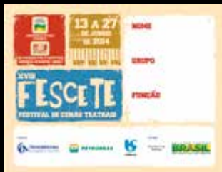
1.700 Crachás de identificação impressos