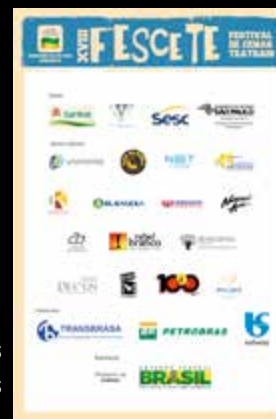
Banner dos Apoiadores