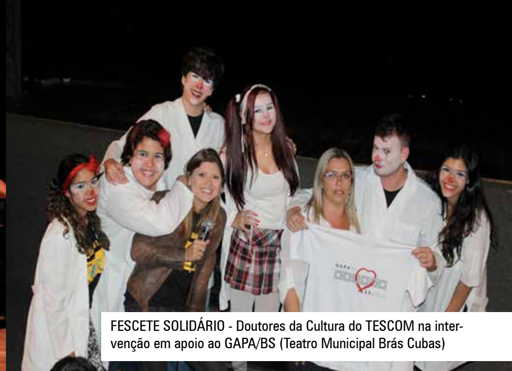
FESCETE SOLIDÁRIO - Doutores da Cultura do TESCOM na intervenção em apoio ao GAPA/BS (Teatro Municipal Brás Cubas)