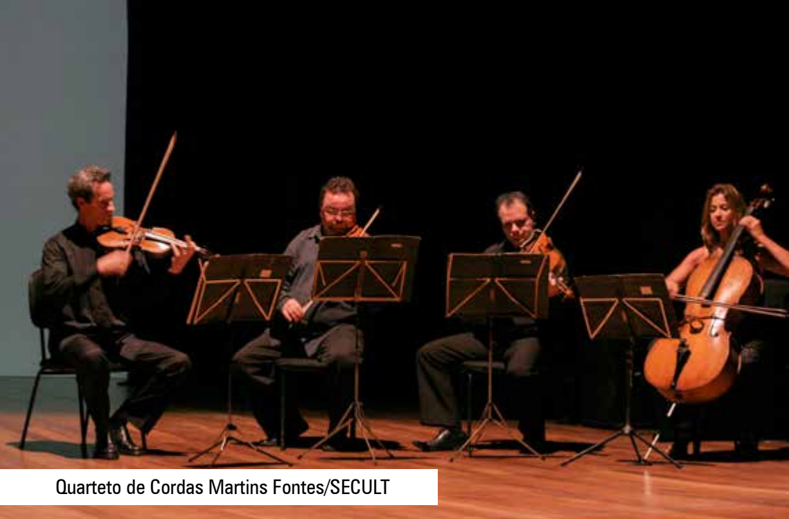
Quarteto de Cordas Martins Fontes/SECULT