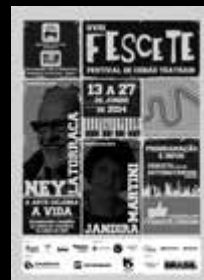
20.000 Flyers PB impressos A5