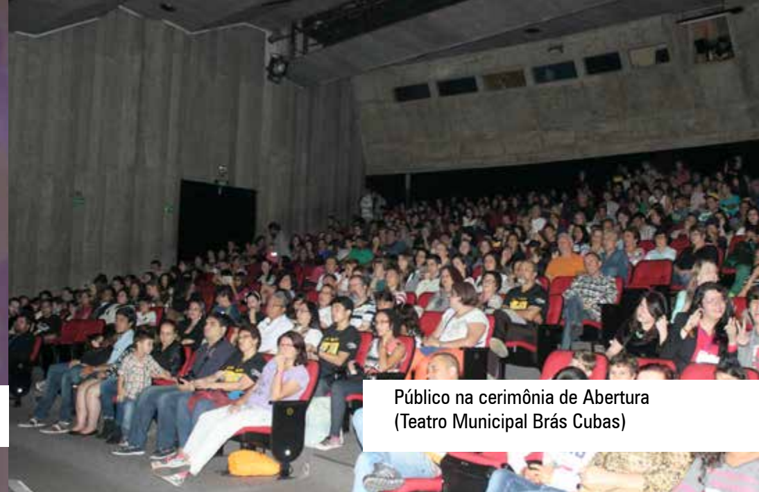
Público na cerimônia de Abertura (Teatro Municipal Brás Cubas)