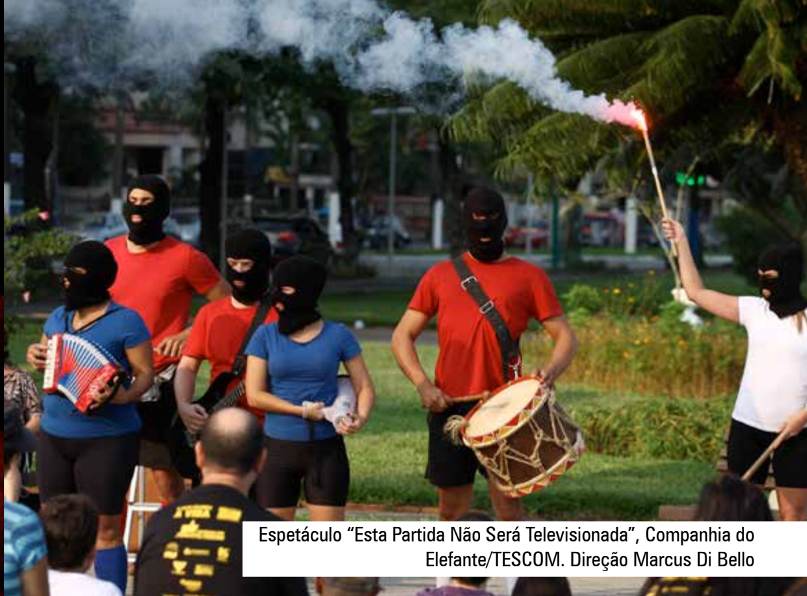
Espetáculo “Esta Partida Não Será Televisada”, Companhia do Elefante/TESCOM. Direção Marcus Di Bello