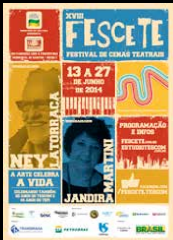
1000 Cartazes A3 impressos