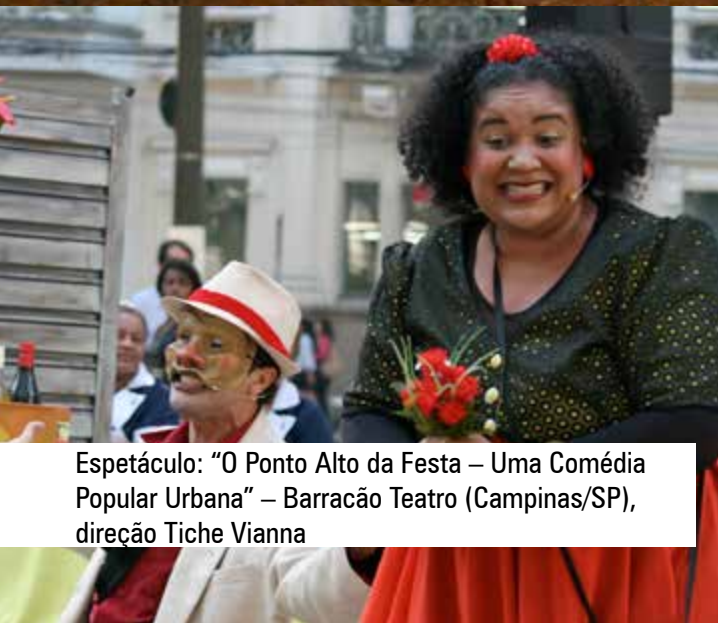
Espectáculo: "O Ponto Alto da Festa – Uma Comédia Popular Urbana" – Barracão Teatro (Campinas/SP), direção Tiche Vianna