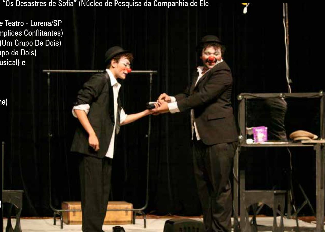
“Entre Atores” (Um Grupo de Dois)

1o Lugar - “Entre Atores” (Um Grupo de Dois)