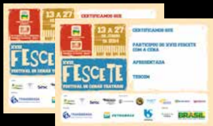
1.500 Certificados impressos em dois modelos, participação e premiação