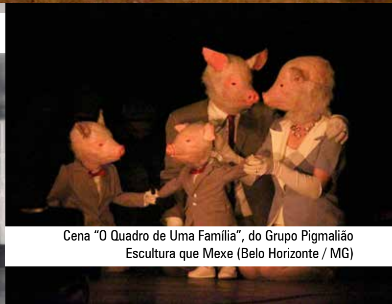
Cena "O Quadro de Uma Família", do Grupo Pigmalião Escultura que Mexe (Belo Horizonte / MG)