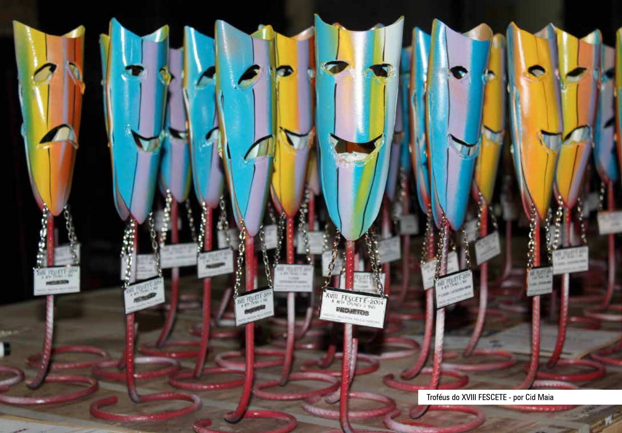
Troféus do XVIII FESCETE - por Cid Maia