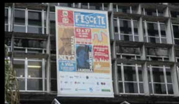
Super Banner para os teatros 425x600cm. E 10 banners de evento com 200x141cm