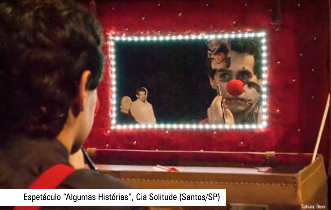
Espectáculo "Algumas Histórias", Cia Solitude (Santos/SP)