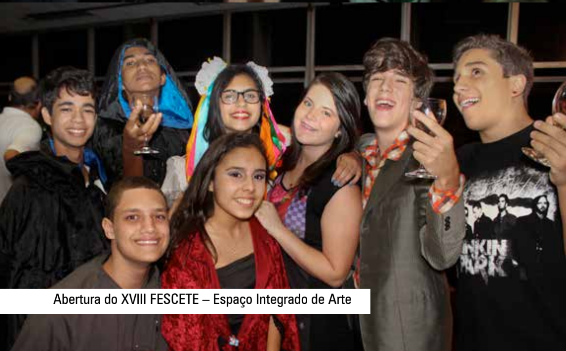
Abertura do XVIII FESCETE – Espaço Integrado de Arte