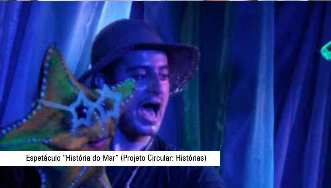
Espectáculo "História do Mar" (Projeto Circular: Histórias)