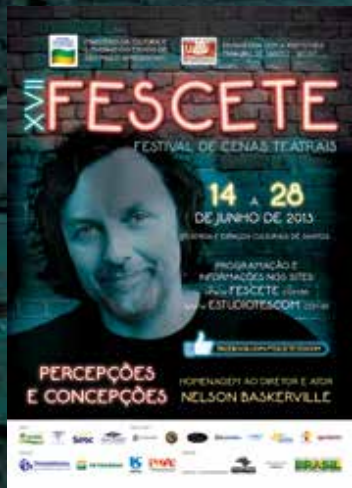
1000 Cartazes A3 impressos