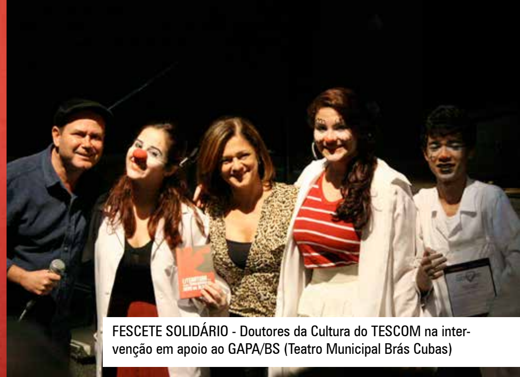
FESCETE SOLIDÁRIO - Doutores da Cultura do TESCOOM na intervenção em apoio ao GAPA/BS (Teatro Municipal Brás Cubas)