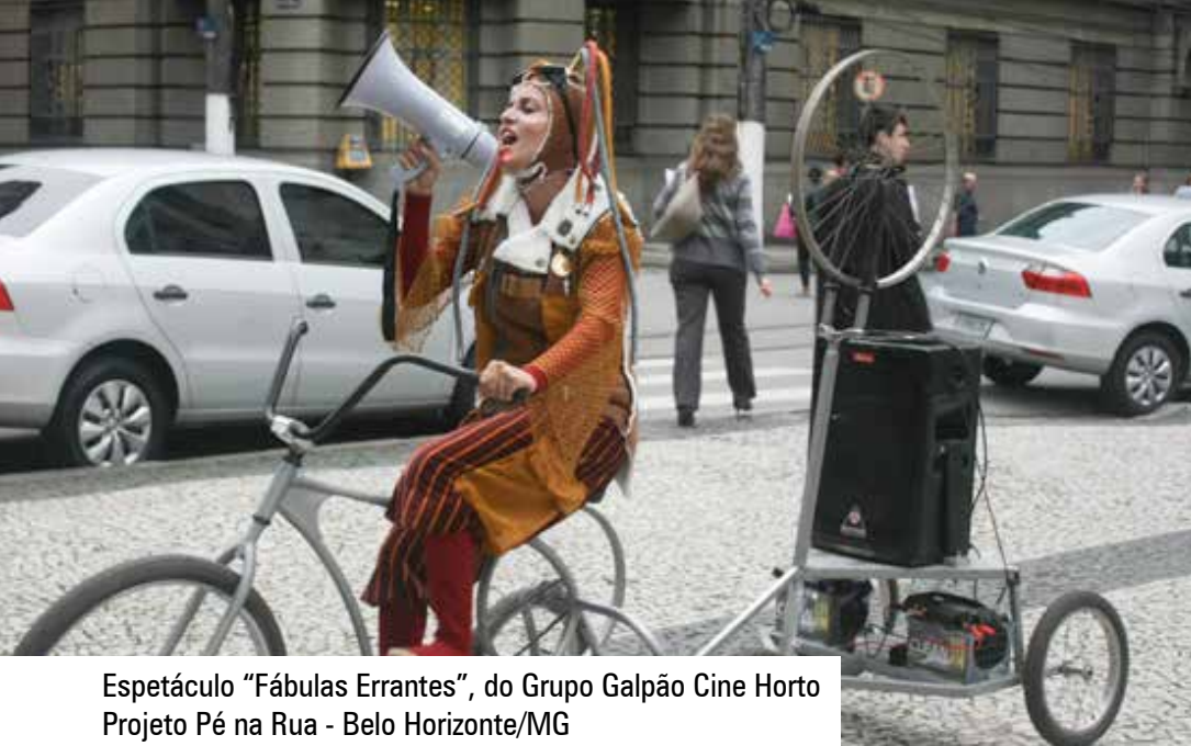
Espectáculo "Fábulas Errantes", do Grupo Galpão Cine Horto Projeto Pé na Rua - Belo Horizonte/MG