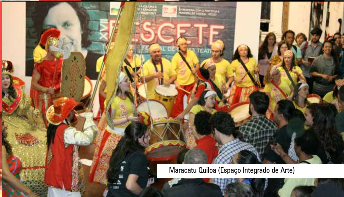
Maracatu Quiloa (Espaço Integrado de Arte)