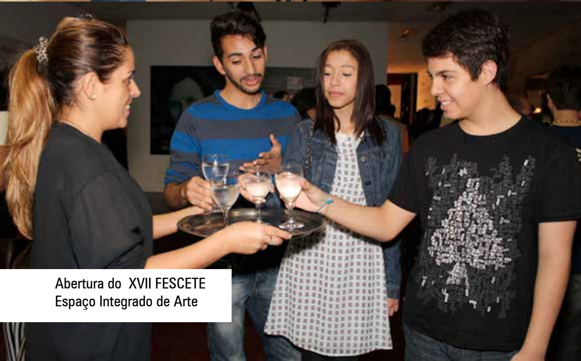
Abertura do XVII FESCETE Espaço Integrado de Arte