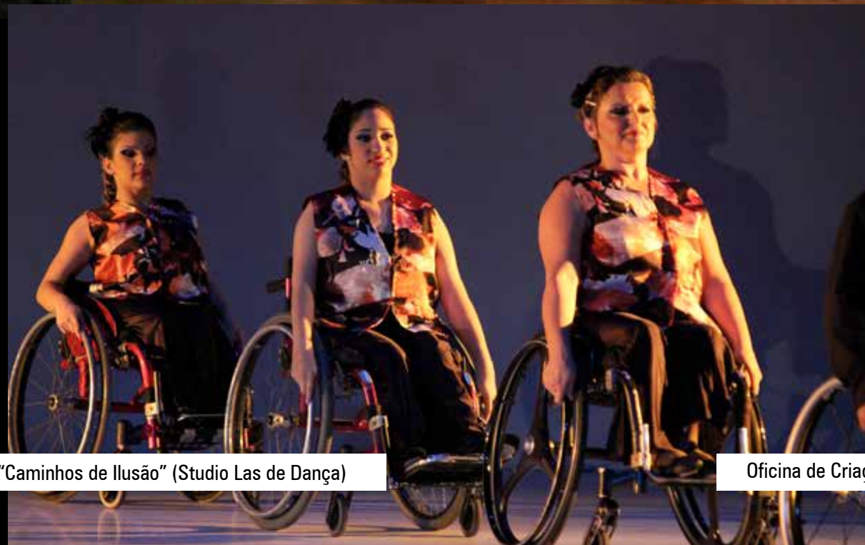
Espectáculo "Caminhos de Ilusão" (Studio Las de Dança)