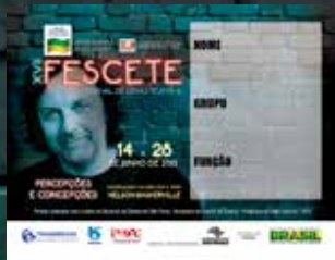
1.200 Crachás de identificação impressos