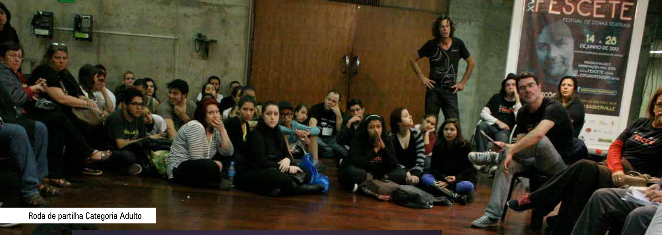
Roda de partilha Categoria Adulto