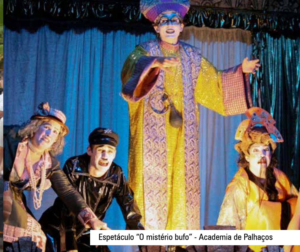
Espectáculo "O mistério bufo" - Academia de Palhaços