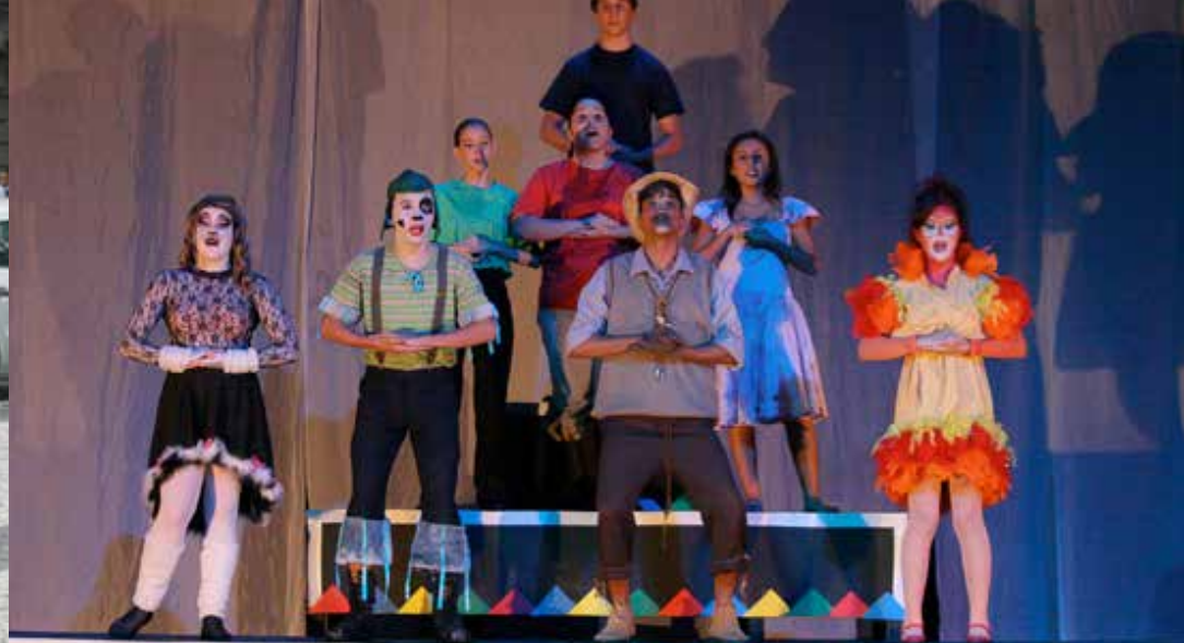
Os Saltimbancos - Arte e estudo Mirim - Melhor Cena no Voto Popular Cat. Mirim