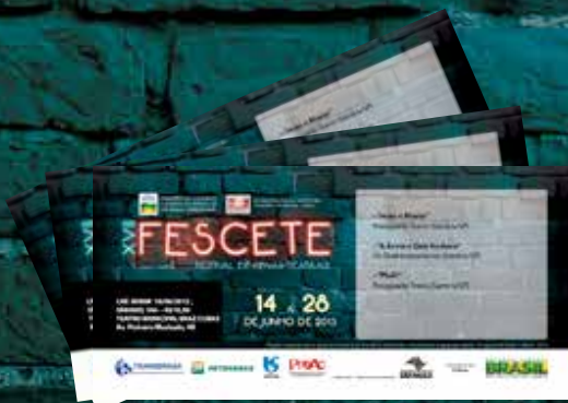
19.500 Ingressos impressos para 30 apresentações.