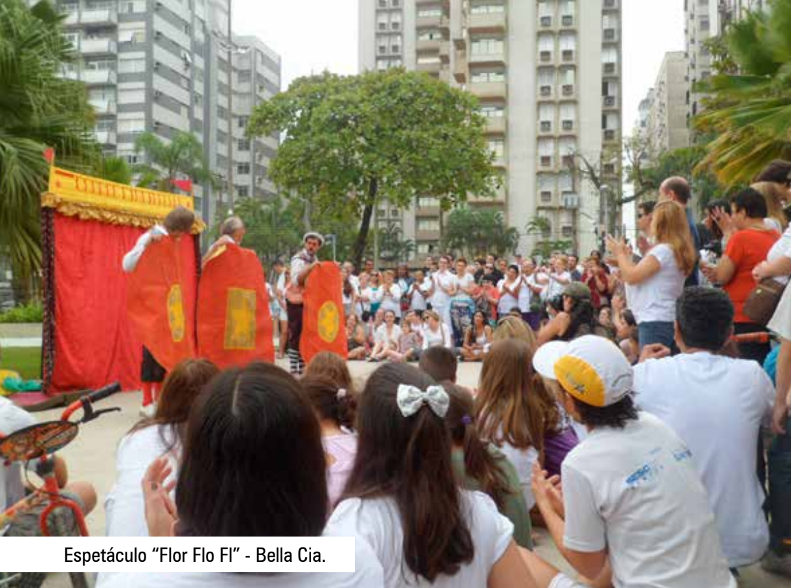
Espectáculo "Flor Flo Fl" - Bella Cia.