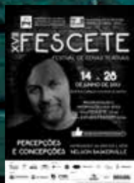
20.000 Flyers PB impressos A5