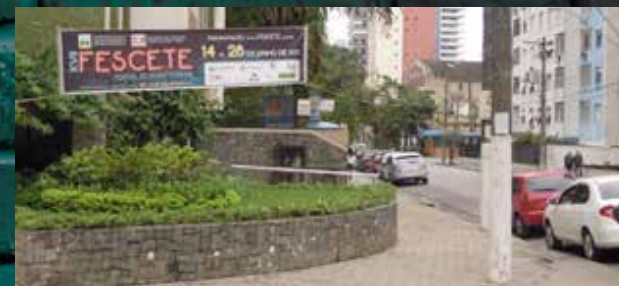
10 Faixas de Rua 300x70cm