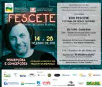
1.500 Convites de abertura impressos e 5.000 digitais por mailing