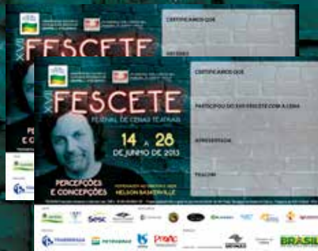
1.500 Certificados impressos em dois modelos, participação e premiação