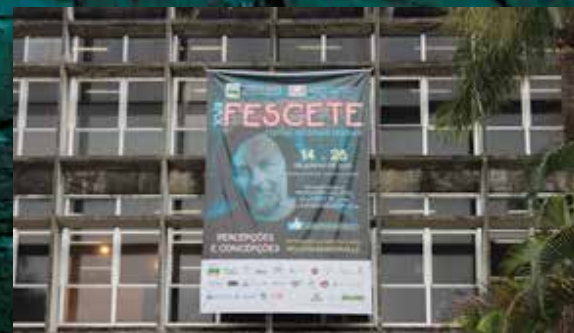
Super Banner para os teatros 425x600cm. E 10 banners de evento com 200x141cm