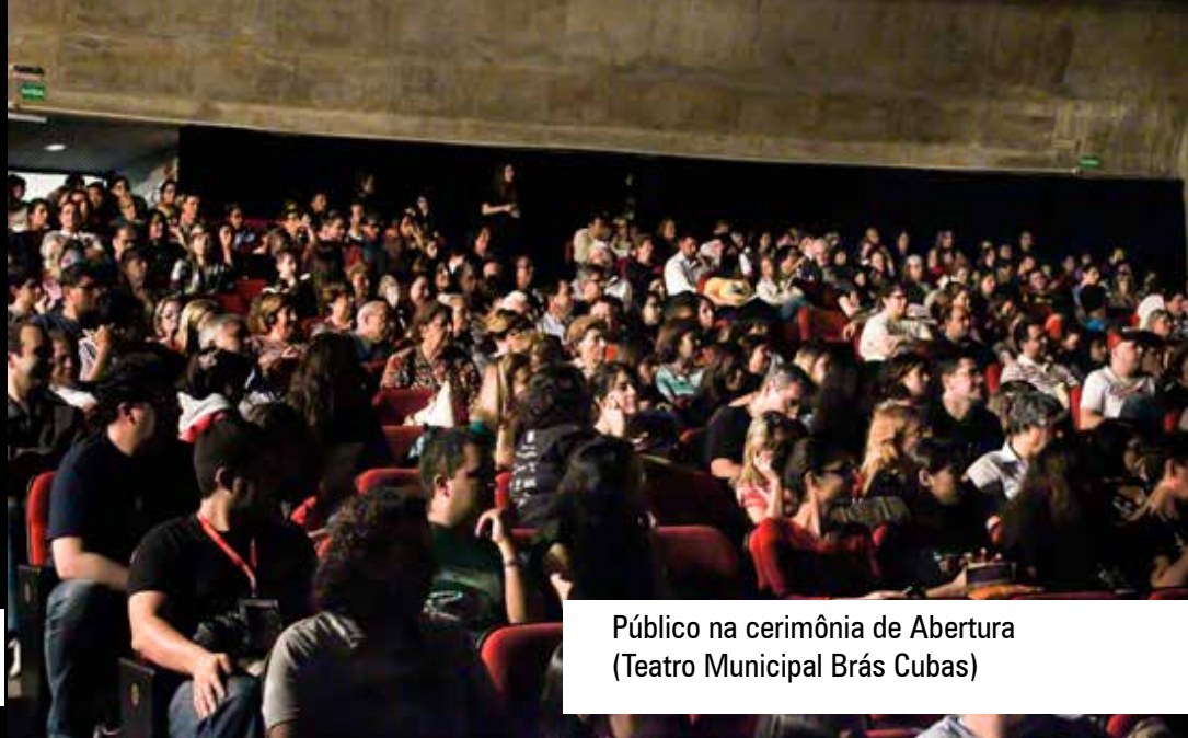
Público na cerimônia de Abertura (Teatro Municipal Brás Cubas)