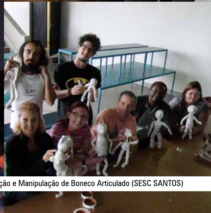
Oficina de Criação e Manipulação de Boneco Articulado (SESC SANTOS)