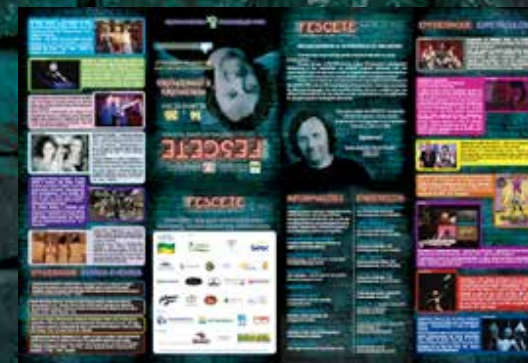
5.000 Guias de Programação (Folder) impressos