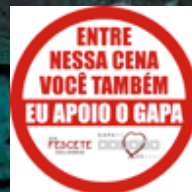
100 Pins promocionais para camiseta