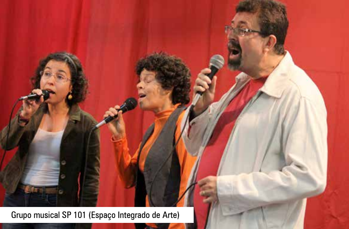
Grupo musical SP 101 (Espaço Integrado de Arte)